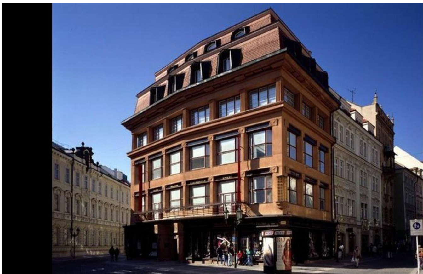
Dům U Černé madony v Praze.

Hledaly se nové cesty v architektuře, ale i v umění. Střídáním různých mat. se rezně neomítané, vyspárované zdivo cihlové nebo bílé barvy v kombinaci s hladkou omítkou. Kubismus byl dalším hledajícím stylem. Vycházel z malířského stylu, který převáděl přírodní tvary do tvarů geometrických. Např. v interiéru nábytek do jehlanů, krystalů, šikmých prostupujících se ploch.