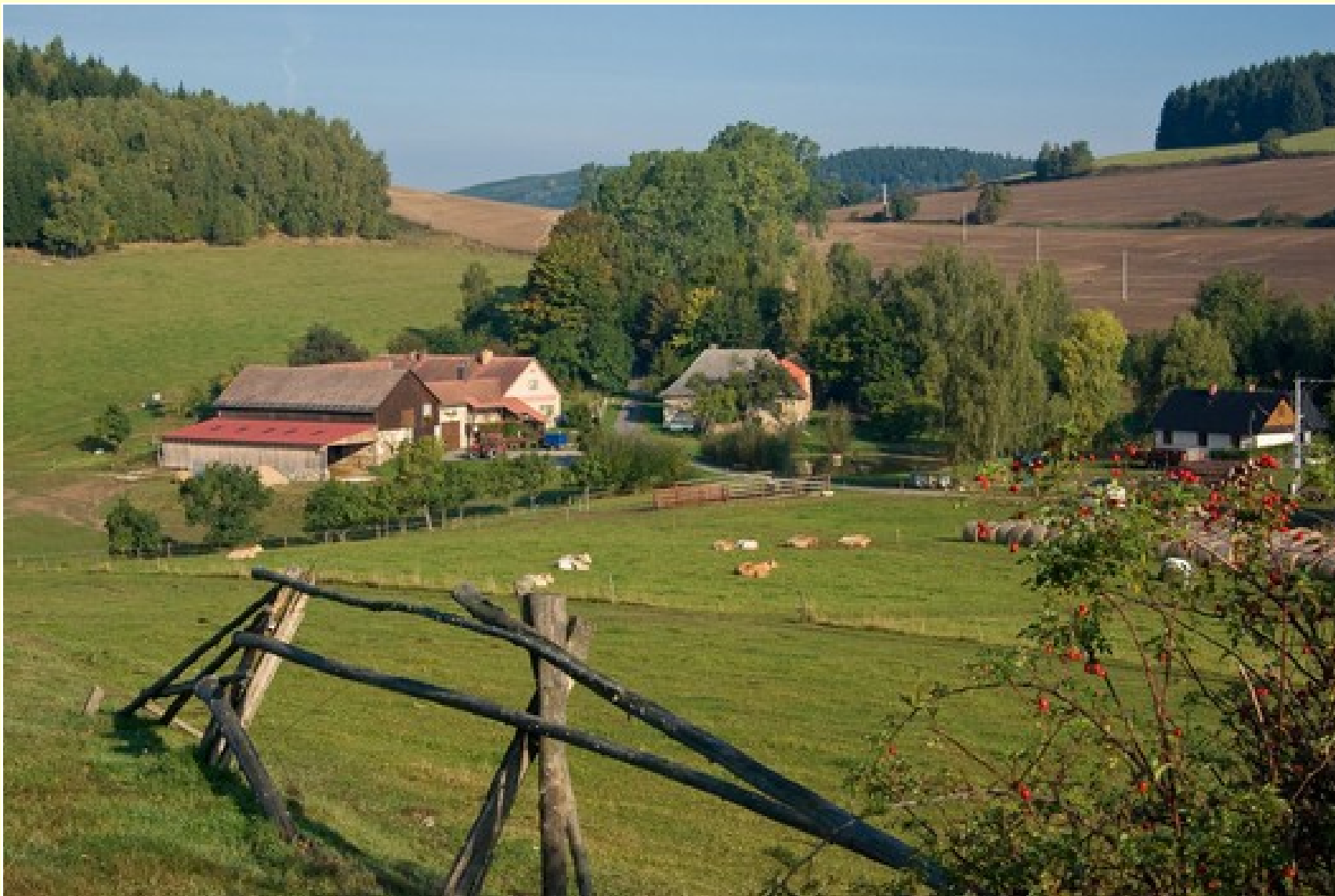
Rodinná ekofarma Husák, osada „Na Louži“, Sněžné (okr. Žďár nad Sázavou)