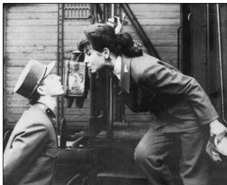
Fotografie z filmu Ostře sledované vlaky , 1966