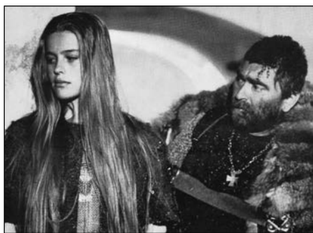
Z filmu Marketa Lazarová , 1967

K autorům, jejichž díla působila svou zakotveností ve slovesném výrazu jako výzva pro filmové tvůrce, náleželi v první řadě Vladislav Vančura a František Hrubín. Nejvýraznějším reprezentantem tohoto směřování byla adaptace Vančurova románu Marketa Lazarová (f. 1967, rež. František Vlácil, sc. František Pavlíček), jež proti autorovu nevšednímu jazyku staví složitou souhru dynamického obrazu, zvuku a hudby. Filmovým experimentem byla adaptace novely Rozmarné léto (f. 1967, rež. Jiří Menzel), která stojí na kontrastu mezi filmovou vizuální konkretizací postav a děje a jejich silně stylizovanými promluvy, zachovávajícími jazyk Vančurových dialogů. Lyrizovaná díla Františka Hrubína – novela Zlatá reneta a básnická skladba Romance pro křídlovku – se stala podnětem k hledání ekvivalentního, tj. poetického filmového vyjadřování ve snímcích Otakara Vávry ( Zlatá reneta , f. 1965; Romance pro křídlovku , f. 1966), režiséra starší generace, který k „nové vlně“ vytvářené generací svých žáků bezprostředně nenáležel, nicméně se dokázal jejími výboji inspirovat. (Ve