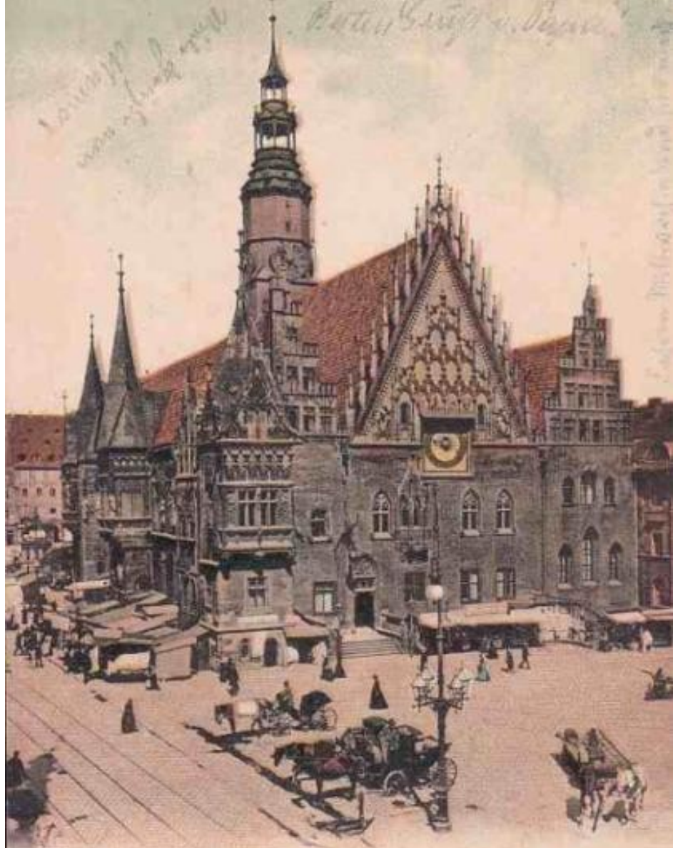
1. A. Fabian & Comp., Breslau.