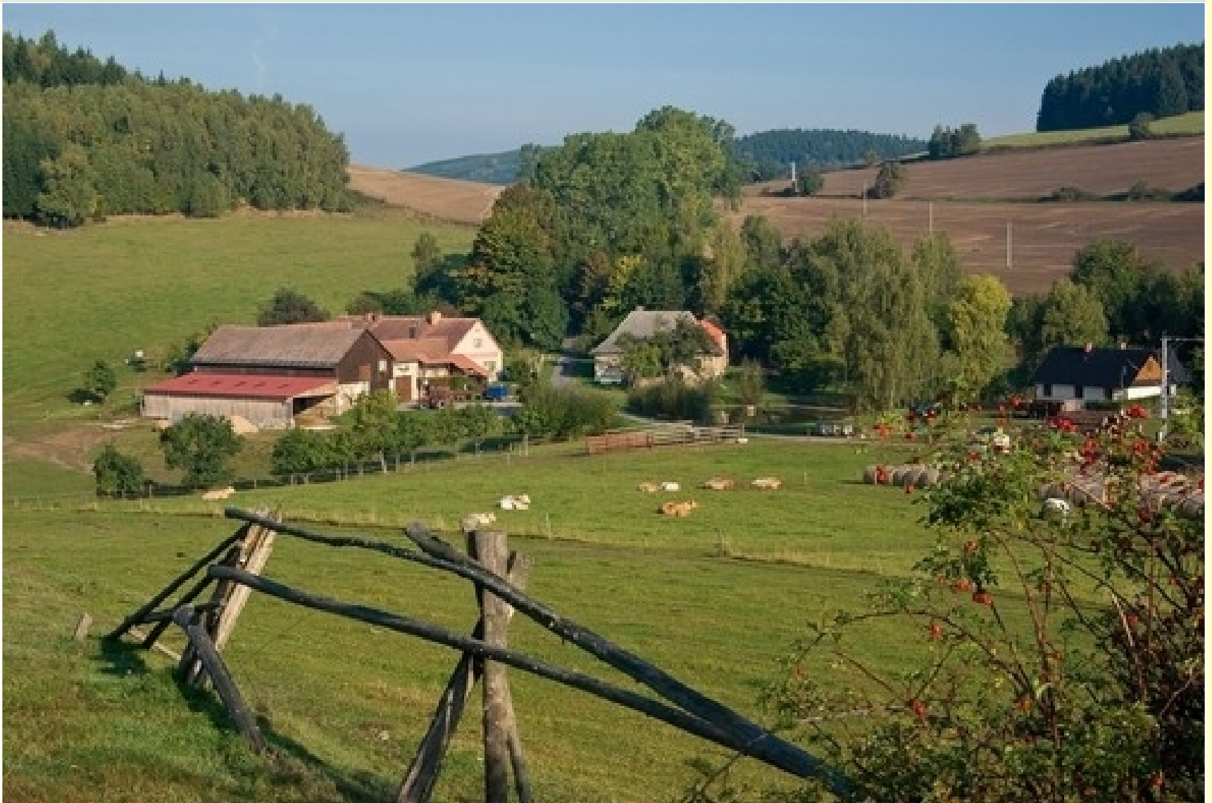
Rodinná ekofarma Husák, osada „Na Louži“, Sněžné (okr. Žďár nad Sázavou)