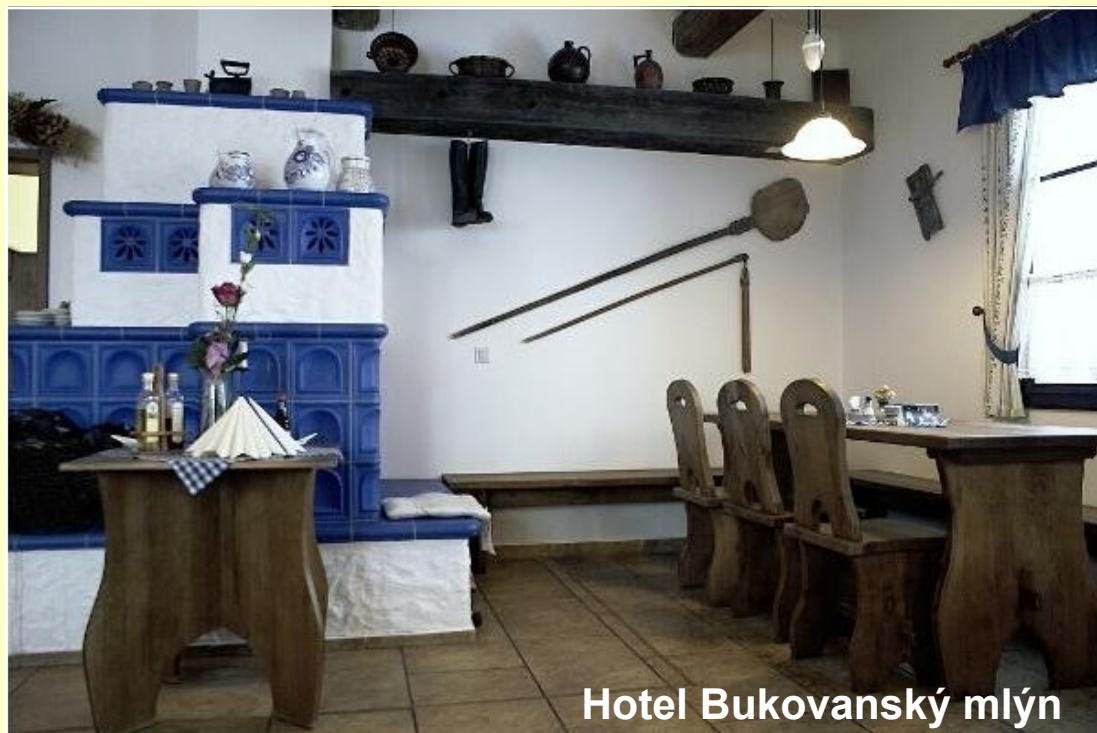
Hotel Bukovanský mlýn