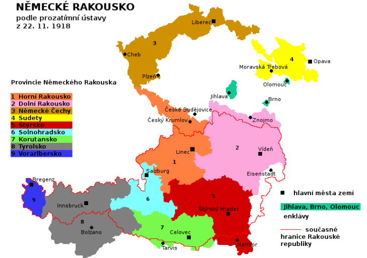
NĚMECKÉ RAKOUSKO podle prozatímní ústavy z 22. 11. 1918

4. 3. 1919 v pohraničí generální stávka (v den, kdy se mělo poprvé sejít rakouské NS) – „Märzegefallene“