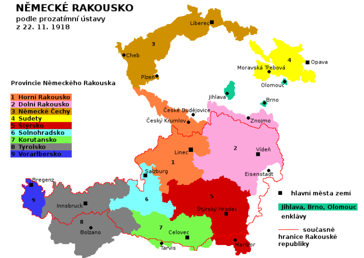
NĚMECKÉ RAKOUSKO podle prozatímní ústavy z 22. 11. 1918

4. 3. 1919 v pohraničí generální stávka (v den, kdy se mělo poprvé sejít rakouské NS) – „Märzegefallene“