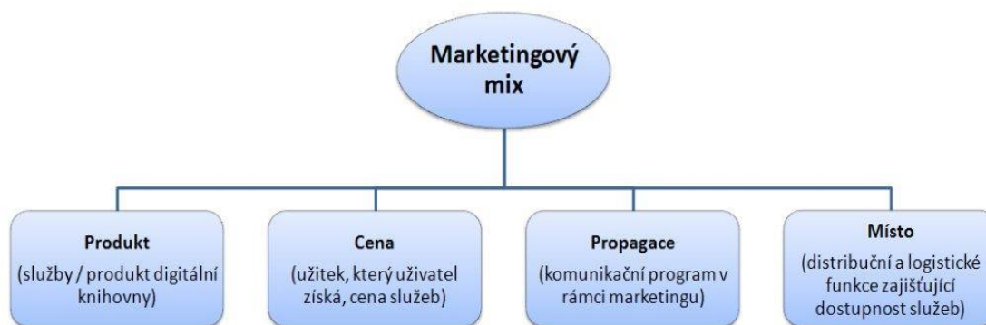
Obr. č. 4 - Marketingový mix