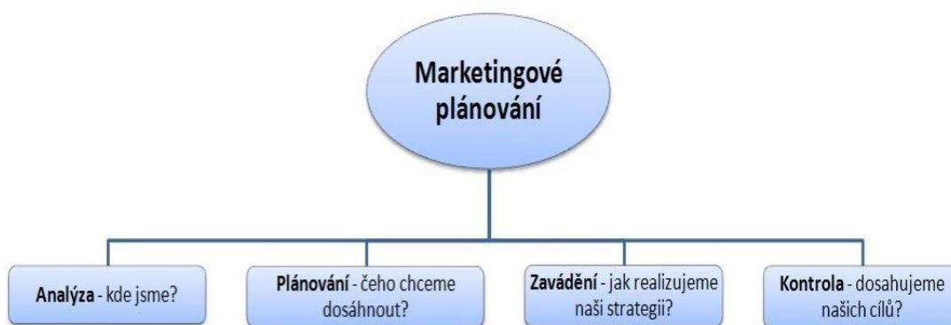
Obr. č. 1– Marketingové plánování (JANEČKOVÁ, L.; VAŠTÍKOVÁ, M. Marketing služeb . Praha : Grada Publishing, 2001, s. 55)

jeho potřeby a přání zjišťuje a že mu své služby přizpůsobuje. Veřejný sektor se soustřeďuje především na naplňování společenských potřeb. Knihovna plní především úlohu vzdělávací. Jedním z cílů může být počet uživatelů, ale také stanovené a vnější užitky. Vzdělávací aj. aktivity knihoven jsou prospěšné nejen samotným uživatelům, ale potažmo celé společnosti. Uživatelem veřejných knihoven se může stát nejen každý občan, ale i celá společnost, která tak získá vzdělané jedince.