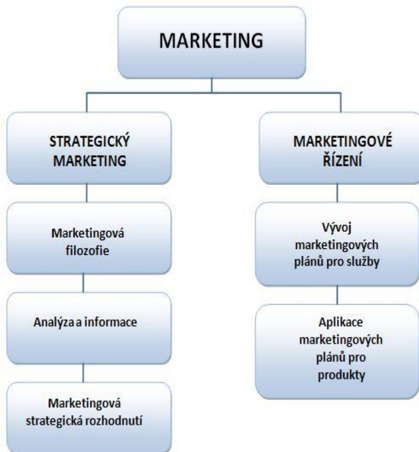
Obr. č. 2 - Role marketingu ve strategickém řízení

Strategický marketing popisuje takové aktivity, které ovlivňují marketingové strategické plány celé knihovny.