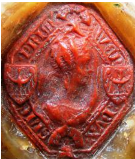
Obrázek 23: Pečeť lehnického knížete Václava I. z roku 1354.