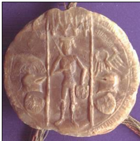
Obrázek 21: Pěší pečeť olešnického a kozelského knížete Konráda III. z roku 1404.