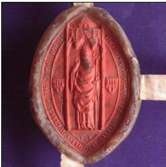
Obrázek 22: Pontifikální pečeť olomouckého biskupa Jana ze Středy z roku 1378.