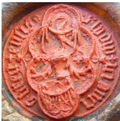
Obrázek 24: Pečeť břežského knížete Ludvíka II. z roku 1402.