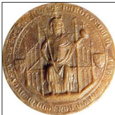
Obrázek 19: Majestátní pečeť Karla IV. jako římského a českého krále z roku 1348.