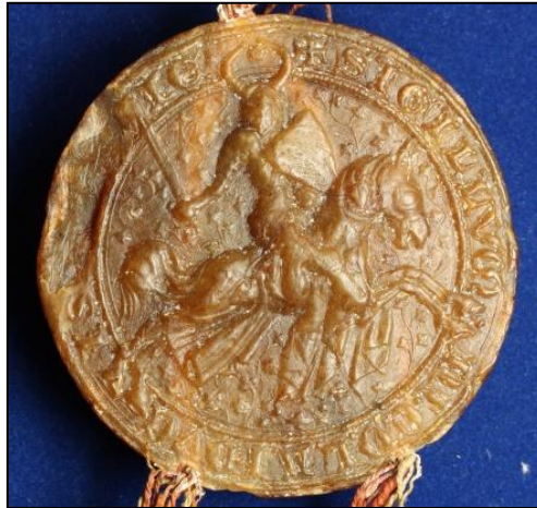
Obrázek 20: Jezdecká pečeť opavského knížete Mikuláše z roku 1318.