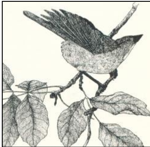
Obrázek 1: Kopulační postoj samice špačka polního

jde o specifický přenos kulturní informace, vyvinutý v procesu ontogeneze, může být velmi obtížné. Toto může být pěkně ilustrováno na příkladu přenosu vzorců ptačího zpěvu. V případě parazitických ptáků jako jsou kukačka nebo špaček polní se jejich ptáčata rodí v hnízdě jiných druhů ptáků, kam jejich rodiče nakladou svá vejce. Ptáčata nikdy nemají možnost spatřit své rodiče a nemohou se tak od nich naučit píseň typickou pro svůj vlastní druh. Přestože vyrůstají v izolaci, odloučení od příslušníků vlastního druhu, při písni samečka vlastního druhu zaujímají samičky „kopulační pozici“, zatímco při zpěvu ptáků jiných druhů ptáků na ně vůbec nereagují. Jejich odpověď na samčí zpěv je vrozená, tedy geneticky determinovaná.