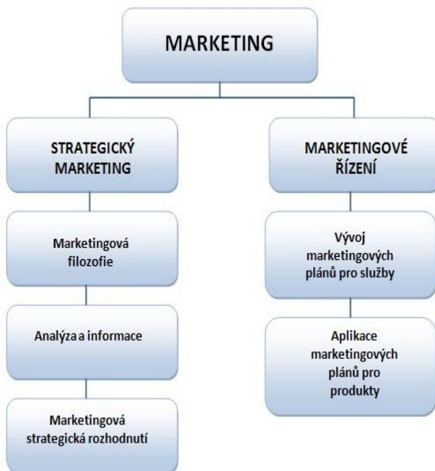
Obr. č. 2 - Role marketingu ve strategickém řízení

Strategický marketing popisuje takové aktivity, které ovlivňují marketingové strategické plány celé knihovny.