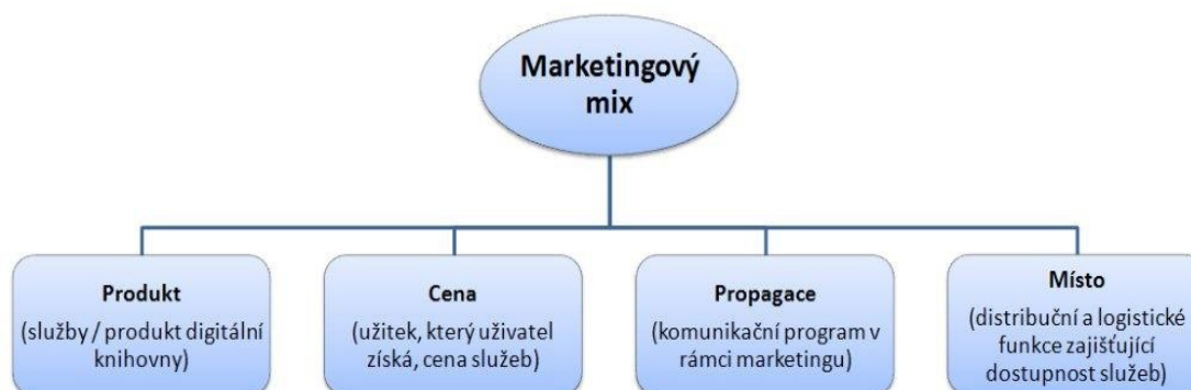
Obr. č. 4 - Marketingový mix