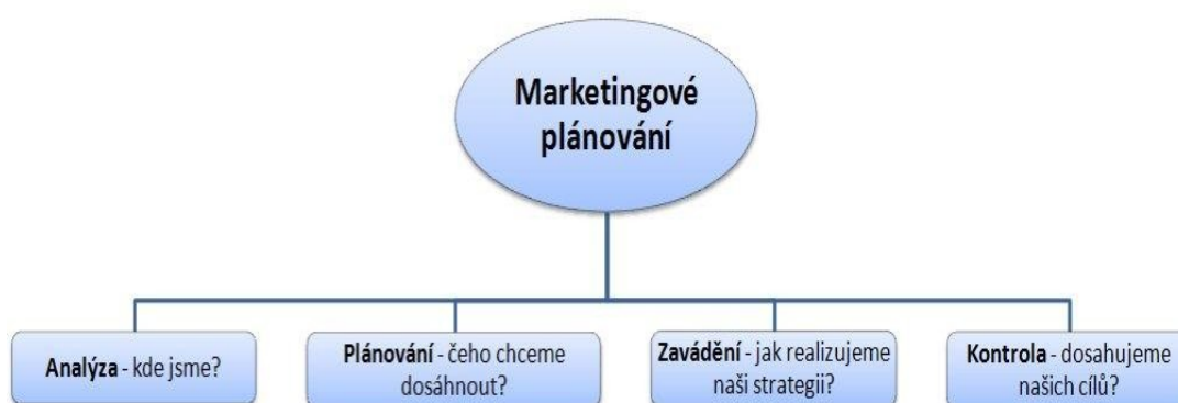
Obr. č. 1– Marketingové plánování (JANEČKOVÁ, L.; VAŠTÍKOVÁ, M. Marketing služeb . Praha : Grada Publishing, 2001, s. 55)

tereso­vaných subjektů, které usilují o vzájemnou spolupráci a o koordinaci svých aktivit. Marketing usiluje o to, aby knihovna poskytovala takové služby, jež uživatel požaduje, a to tím, že jeho potřeby a přání zjišťuje a že mu své služby přizpůsobuje. Veřejný sektor se soustřeďuje především na naplňování společenských potřeb. Knihovna plní především úlohu vzdělávací. Jedním z cílů může být počet uživatelů, ale také stanovené a vnější užitky. Vzdělávací aj. aktivity knihoven jsou prospěšné nejen samotným uživatelům, ale potažmo celé společnosti. Uživatelem veřejných knihoven se může stát nejen každý občan, ale i celá společnost, která tak získá vzdělané jedince.