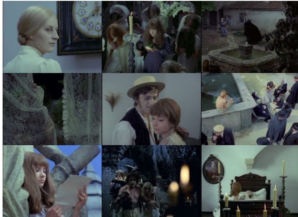
Valérie a týden divů, rež. J. Jireš (1970), trezorový film