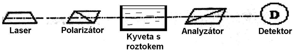
Obr. 2 – Experimentální uspořádání pro stanovení stáčivosti roztoku sacharózy

kde m_s je hmotnost opticky aktivní látky, m_r je hmotnost roztoku a \rho_r je hustota roztoku. Experimentální uspořádání pro studium optické aktivity roztoku sacharózy je na Obr. 2.