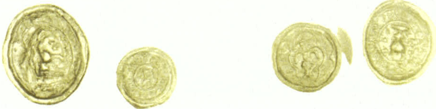
Listina tábořských hejtmanů a obce Písku z r. 1420.

nými ďábly; když ho spatřil, shodil kápi mezi preláty na zem, vzal klobouk a nasadil si jej na hlavu řka: „Můj pán Ježíš Kristus měl, jda na smrt, na hlavě trnovou korunu. Já pak namísto oné koruny chci rád z lásky k němu nést tento klobouk.“ A hned se ho chopili svěští biřici.