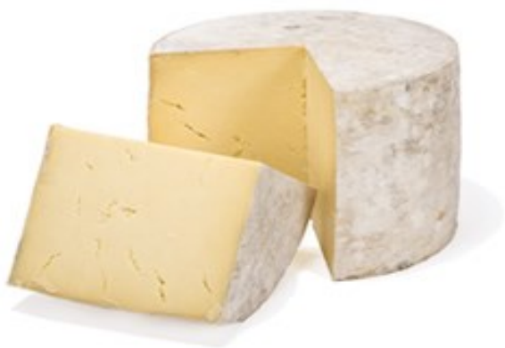
Obrázek č.2: Sýr cheddar

Pilgrim's Choice Mild White - jemný světlý cheddar. Doba zřání 4 měsíce.