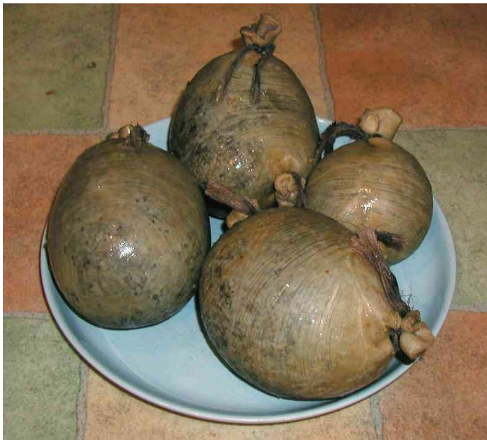
Obrázek č.6: Haggis