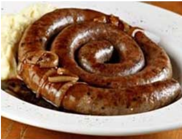
Obrázek č.3: Párek Cumberland (Cumberland sausage)

Ve Velké Británii a Irsku jsou velmi populární klobásy. Britské a irské klobásy jsou obvykle vyrobené ze syrového vepřového nebo hovězího masa ve směsi s různými bylinkami a kořením a obilovin. Je známo mnoho receptů, které jsou tradičně spojovány s konkrétní oblastí (například párky Cumberland ). Ty obvykle obsahují určité množství tvrdé topinky nebo suchary a používají se tradičně na vaření, smažení, grilování či pečení.