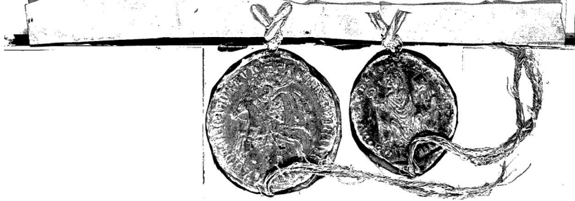
Českým králem Přemyslem Otakarem I. vystavená confirmace práv uničovské městské obce z roku 1223.