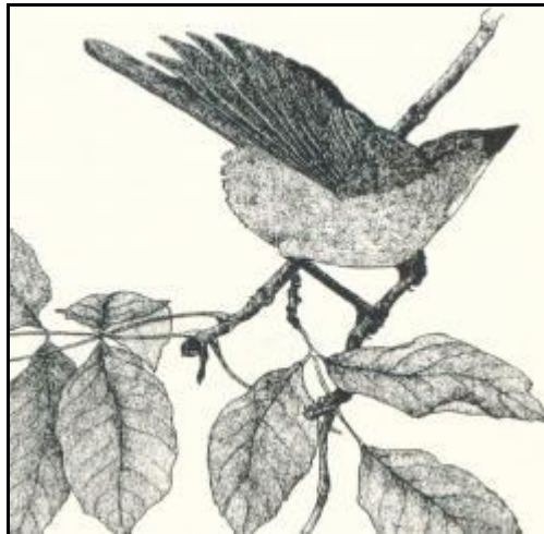
Obrázek 1: Kopulační postoj samice špačka polního

jde o specifický přenos kulturní informace, vyvinutý v procesu ontogeneze, může být velmi obtížné. Toto může být pěkně ilustrováno na příkladu přenosu vzorců ptačího zpěvu. V případě parazitických ptáků jako jsou kukačka nebo špaček polní se jejich ptáčata rodí v hnízdě jiných druhů ptáků, kam jejich rodiče nakladou svá vejce. Ptáčata nikdy nemají možnost spatřit své rodiče a nemohou se tak od nich naučit píseň typickou pro svůj vlastní druh. Přestože vyrůstají v izolaci, odloučení od příslušníků vlastního druhu, při písni samečka vlastního druhu zaujímají samičky „kopulační pozici“, zatímco při zpěvu ptáků jiných druhů ptáků na ně vůbec nereagují. Jejich odpověď na samčí zpěv je vrozená, tedy geneticky determinovaná.