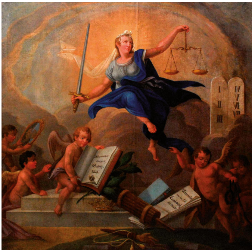
Alegorie Všeobecného občanského zákoníku od Ignaze Pieschela. Muzeum města Ústí nad Labem.