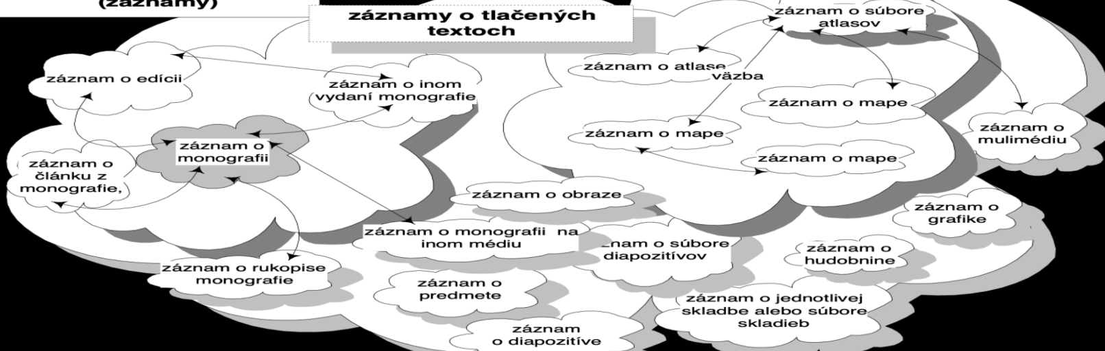
Obrázok Schéma vzťahov univerza prototextov a univerza metatextov