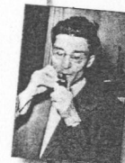
Cesare Pavese, Poesie edite e inedite

Sarà un cielo chiaro. Si apriranno le strade sul colle di pini e di pietra. Il tumulto delle strade non muterà quell'aria ferma. I fiori spruzzati di colori alle fontane occhieggeranno come donne divertite. Le scale le terrazze le rondini canteranno nel sole. Si aprirà quella strada, le pietre canteranno , il cuore batterà sussultando come l'acqua nelle fontane sarà questa la voce che salirà le tue scale. Le finestre sapranno l'odore della pietra e dell'aria mattutina. Si aprirà una porta. Il tumulto delle strade sarà il tumulto del cuore nella luce smarrita. sarai tu – ferma e chiara.