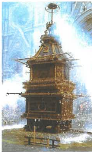
• In Italia il presepe ha una lunga tradizione. • Lo scoppio del carro a Firenze la domenica di Pasqua.