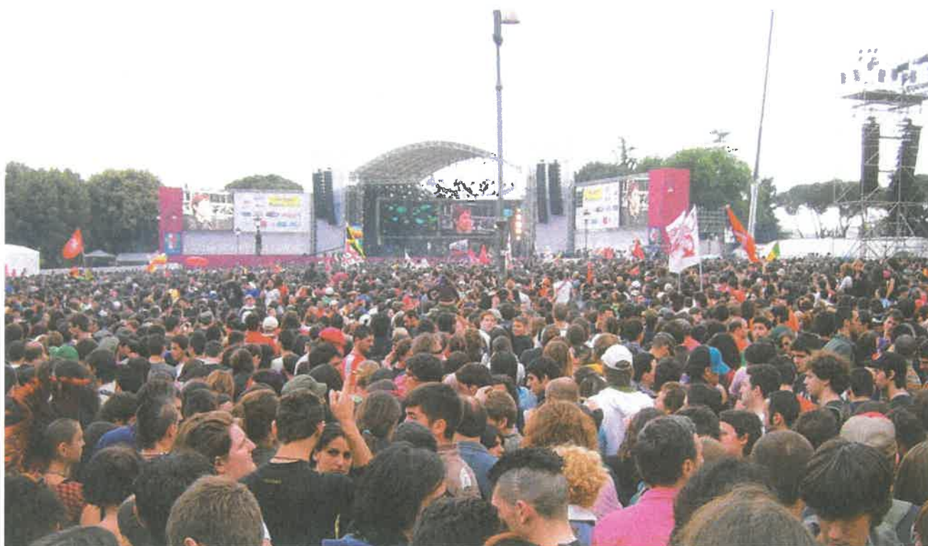
• Il palco per il grande concerto del primo maggio in piazza San Giovanni a Roma.

Il 2 giugno è la festa della Repubblica, nata con il referendum del 2 giugno 1946 con il quale gli italiani scelsero la repubblica come forma di governo per il Paese, fino a quel momento governato dalla monarchia dei Savoia. La festa prevede cerimonie ufficiali e parate militari. Un momento solenne è quando il presidente della Repubblica colloca una corona d'alloro sulla tomba del Milite ignoto, che rappresenta tutti i morti in guerra non riconosciuti.