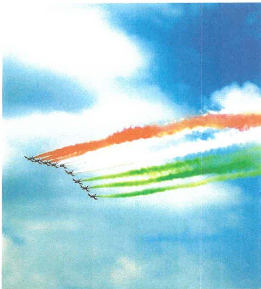
• Le Frece tricolori, la flotta acrobatica dell'Aeronautica italiana, si esibiscono per i festeggiamenti del 2 giugno.

Feste nazionali sono il 25 aprile , anniversario della liberazione dell'Italia dai nazisti, avvenuta nel 1945, e il primo maggio , festa del lavoro, in cui si ricordano le lotte e l'impegno delle organizzazioni sindacali in difesa dei lavoratori. Da anni, in questo giorno, in piazza San Giovanni a Roma i sindacati organizzano un grande concerto che va avanti fino a sera e al quale partecipa l'intero mondo musicale italiano, dagli artisti meno conosciuti alle star che riempiono gli stadi.