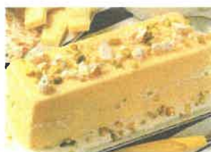
• Panettone, pandoro e torrone sono i tipici dolci natalizi italiani.