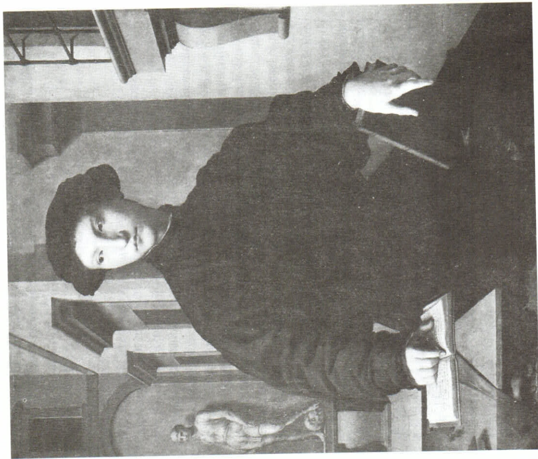
AGNOLO BRONZINO, Ugolino Martelli. Gemäldegalerie, Staatliche Museen, Preussischer Kulturbesitz, Berlin

rodinné vztahy k Medicejským: jeho otec pro ně pracoval před jejich vyhnáním z Florencie v roce 1494. Po jejich restauraci v roce 1513 se Baccio představil bratrům Giovannimu (brzy se stal papežem jako Lev X.) a Giulianovi, nabídl jim dar a oplátkou obdržel objednávku. Bandinelli pracoval rovněž pro Giulia de' Medici, který se stal papežem jako Klement VII. Očekával zakázku na náhrobky obou medicejských papežů a v této věci navštěvoval kardinála Salviatiho tak často, že byl omylem považován za zvěda a málem zavražděn (Boase, 1979; Vasari, Život Bandinelliho ).