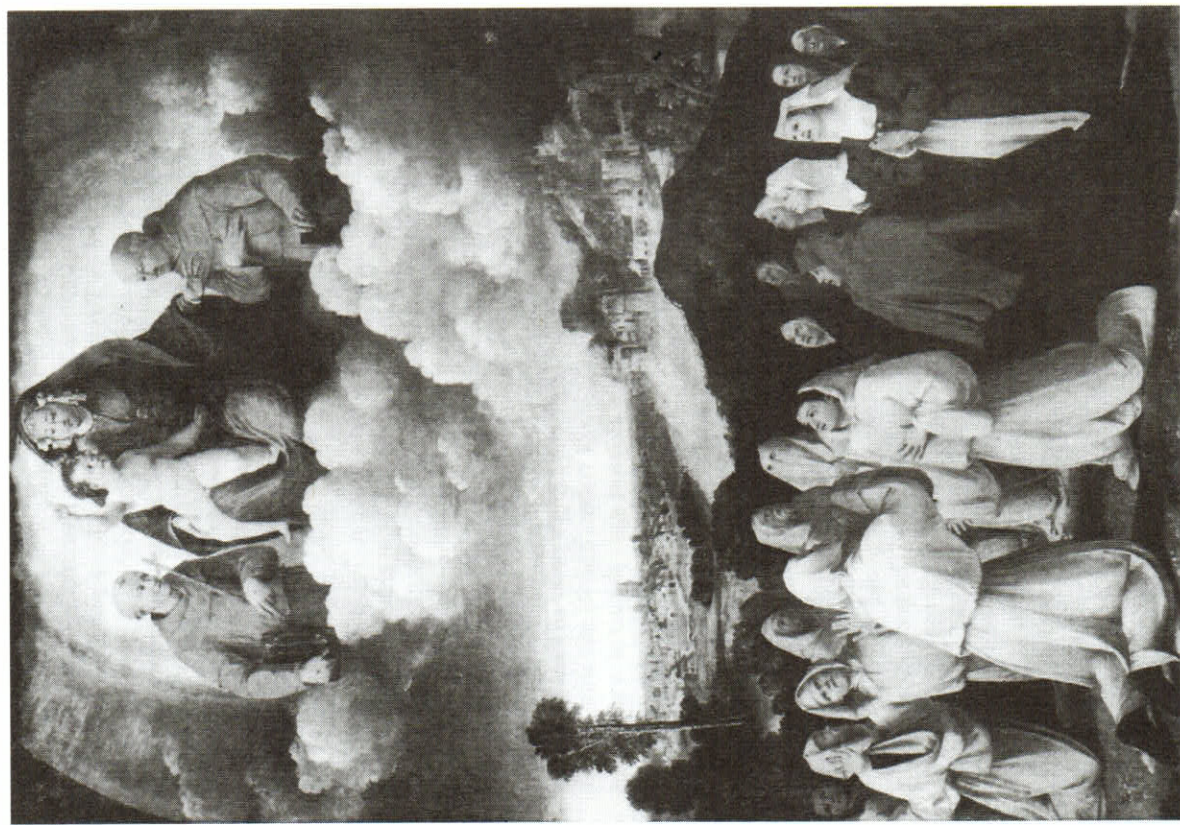
BATTISTA DOSSI, Madona se svěťci a bratrstvem. Galleria Estense, Modena

U vévodů a dalších vládců je často obtížné rozhodnout, zda patronace je veřejná nebo soukromá, zda patron osobně objednal veškerá umělecká díla vzniklá k jeho prospěchu. Je však zřejmé, že styl této dvorské patronace se značně odlišoval od patronace cechů a různých výborů. Pro-