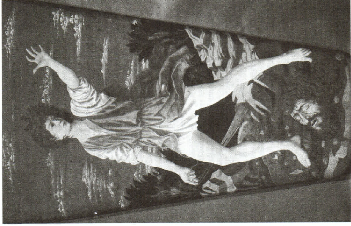
ANDREA DEL CASTAGNO, Mladistvý David. Malovaný štít. National Gallery of Art, Washington, Widener Collection, inv. č. 1942, 9. 8.

Nejzávažnější rozdíl je pravděpodobně mezi patrony, zpravidla vévoddy, kteří vzali umělce do svých služeb více či méně natrvalo (Leonardo v Miláně, Mantegna v Mantově apod.), a zákazníky, kteří obvykle objednali jen jedno dílo. Z hlediska umělců, jak dalece to lze vůbec rekon-