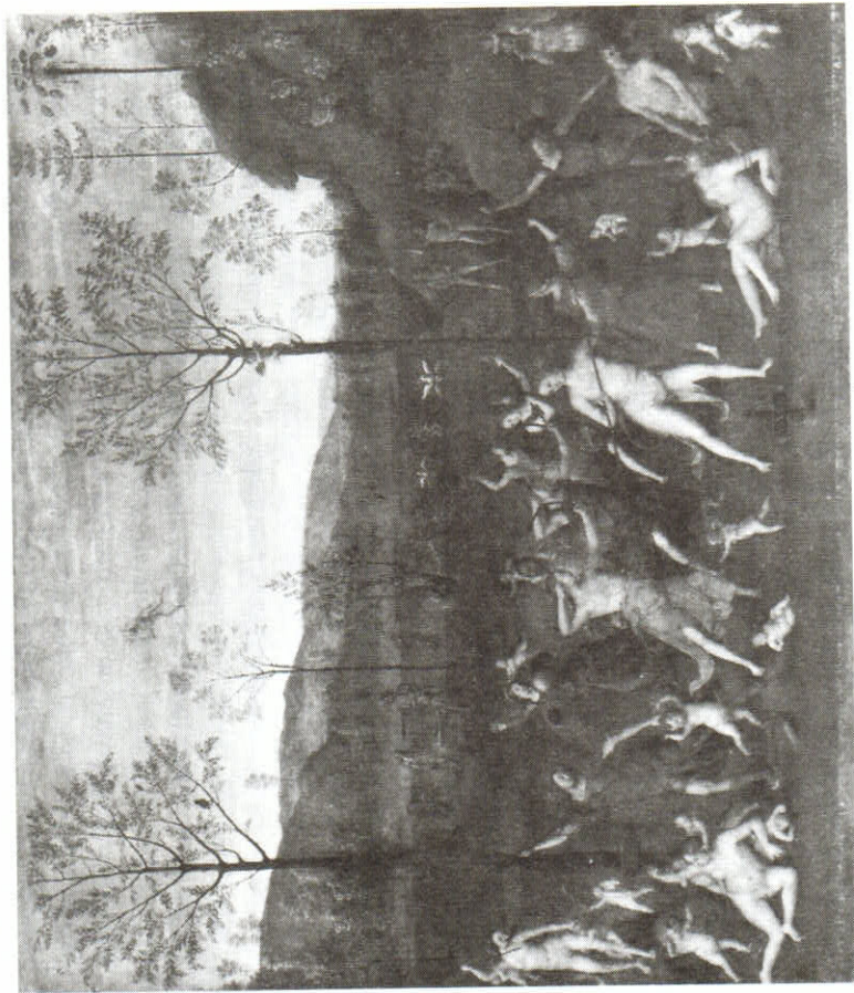
PIETRO PERUGINO, Boj Lásky a Cudnosti. Musée du Louvre.

Vedle těchto popisů a kreseb se ještě mohou vyskytovat více či méně