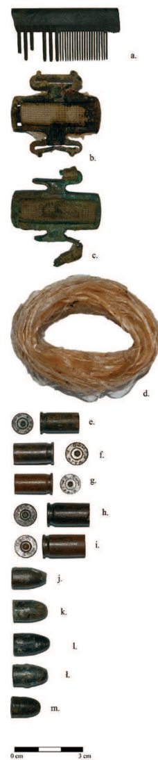
■ Obr. 20 Nálezy ze střelnice Brus – fragment hřebene, kovové přezky, lanko, nábojnice a kulky.

Článek je výstupem projektu SGS-2014-052 Archeologie konfliktů 20. století – výzkum břemadních hrobů ze 40. a 50. let v Polsku .