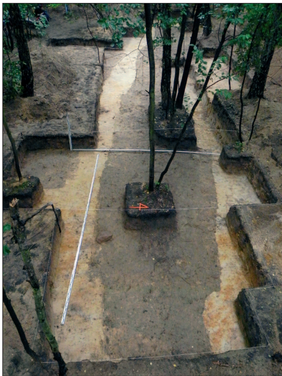
■ Obr. 17 Obrys hrobové jámy v lese Okręglik.