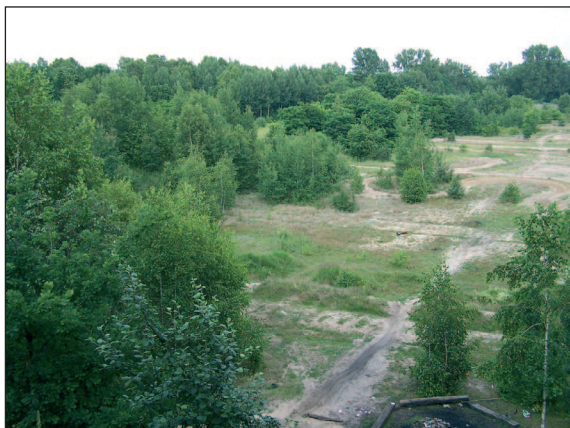
■ Obr. 18 Bývalá střelnice Lodž-Brus, léto 2012.