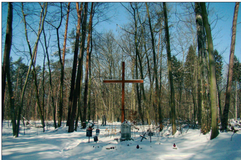
■ Obr. 11 Třetí z lučiměřských pomníků s tabulkami se jmény popravených Poláků, zima 2013.