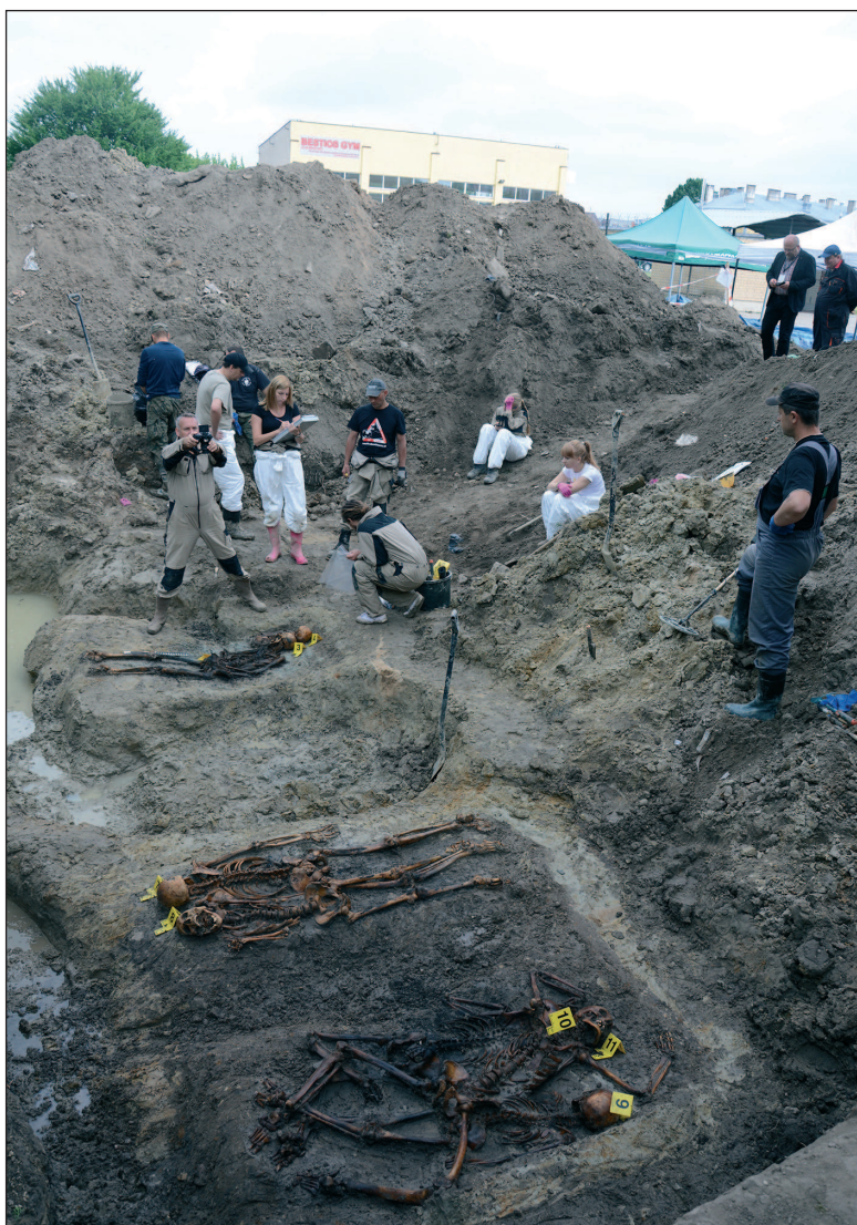
■ Obr. 3 Exhumace obětí totalit na zahradě vězení v Bělostoku, červen 2015.