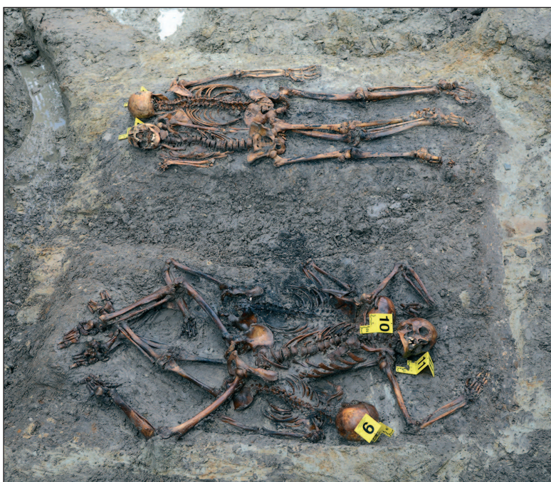
■ Obr. 4 Hromadné hroby obětí v Bělostoku.

Obzvláště pokud porovnáme současný stav u nás se sousedním Polskem, kde je dnes problematika obětí totalitních režimů sledována velmi intenzivně a s velkou politickou i finanční podporou. Vše začalo v 90. letech výzkumy na místech hromadných hrobů polských důstojníků a členů inteligence, kteří byli zavražděni v letech 1940 a 1941 sovětskou NKVD na území dnešní Ukrajiny. Nejznámějším takovým místem je Katyň, ale podobných míst exekuce je více. Celkem Sověti popravili kolem 25 tisíc osob. V následujících obdobích začaly podobné výzkumy též na území Polska. Cílem bylo vyhledávání zejména osob popravených s nástupem komunistického režimu, včetně cíleného vyhledávání hrobů známých a významných odbojářů. Na rozdíl od našeho území totiž nebyly oběti totalitních represí zpověňovány, ale pohřbívány. Často i na fungujících hřbitovech, jen na neoznačených místech v hromadných hrobech (např. u zdí). Výzkumy tohoto typu tak proběhly v řadě velkých měst včetně Varšavy, Vratislavi či Toruně. Nalezený kosterní materiál je podroben důkladné antropologické analýze, včetně odběru vzorku DNA pro přesnou identifikaci, přičemž příbuzní pohřešovaných dávají svou vlastní DNA pro porovnání (Ławrynowicz – Żelazko 2015).