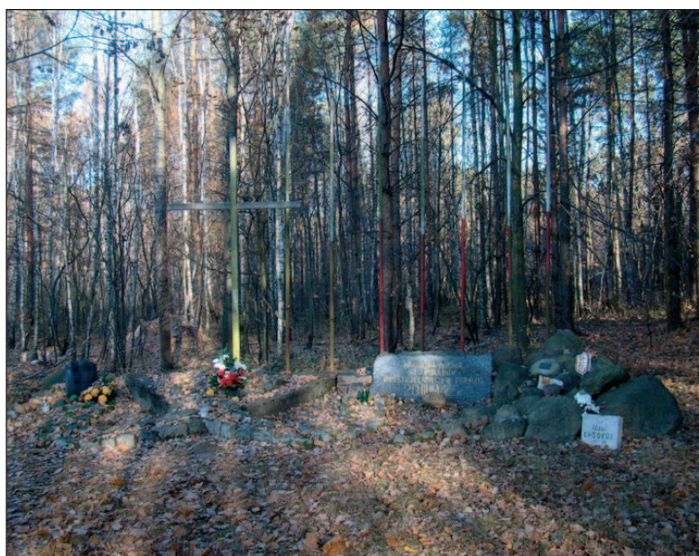
■ Obr. 7 Pomník odkazující na společný hrob sta Poláků v Lučiměřském lese.