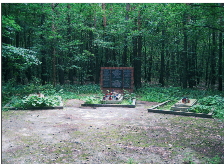
■ Obr. 16 Pomník popraveným harcerům v lese Okreglik.

mohlo jedna o zbytky rakve. K potvrzení byla proto provedena exkavace místa.