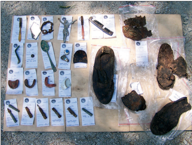
■ Obr. 14 Nálezy z hrobu.