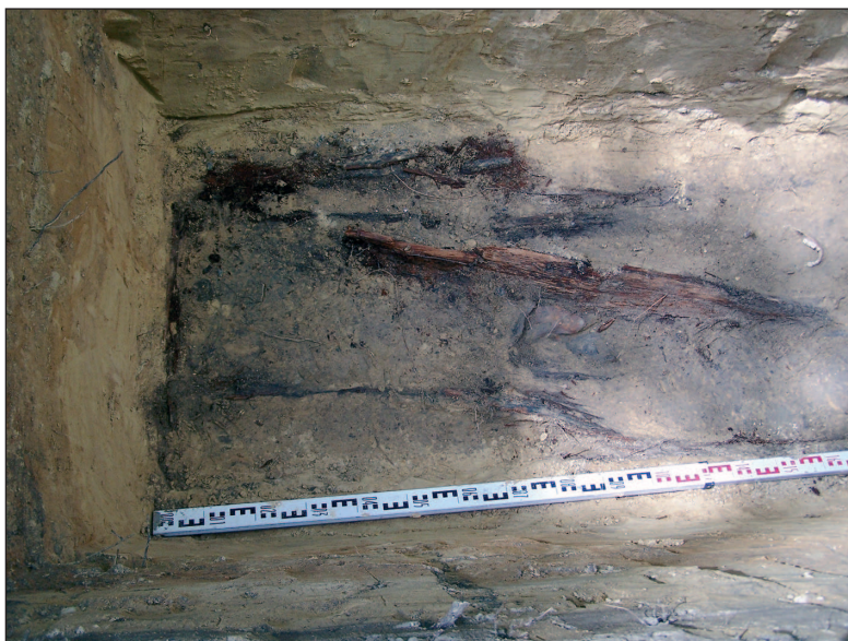
■ Obr. 12 Rozpadlá rakev a lidské pozůstatky na hloubce 1,5 metru uvnitř pomníku.