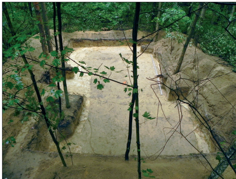
■ Obr. 8 Obrys hrobové jámy po odebrání lesní vrstvy.

Po skončení války probíhaly v Polsku, stejně jako na našem území, exhumace obětí nacistické okupace. K jedné takové došlo i v Lučiměřském lese. Z dochovaných záznamů však nebylo jasné, kam byla těla přenesena. V samotném lese se nachází trojice pomníků, které odkazují na události z doby 2. světové války. Jeden, z roku 1973, je u hlavní cesty z Lodže a odkazuje na popravy prováděné na území lesa. Druhý, vybudovaný v roce