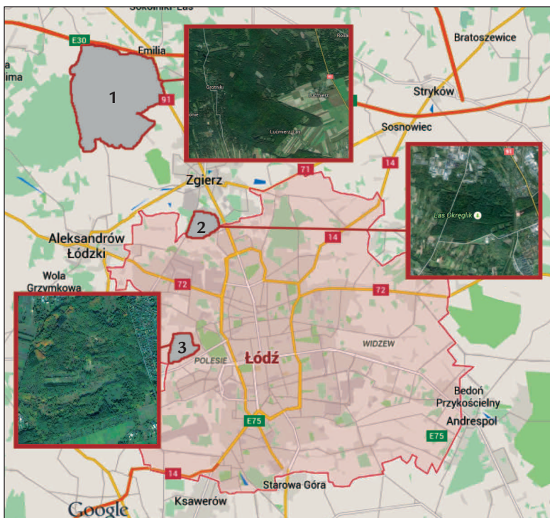
■ Obr. 6 Místa výzkumů hromadných hrobů v okolí Lodže. 1 Lučiměřský les, 2 Les Okreglik, 3 Strelnice Brus.

Výzkum se tak zaměřil na nalezení nějakých stop po osudu těl sta Poláků, kteří byli popraveni 20. března 1942 na náměstí města Zgierz. Jednalo se o odvetu za zastřelení dvou příslušníků gestapa členem Zemské armády Józefem Mierzyńským. Ten byl zatčen 6. března