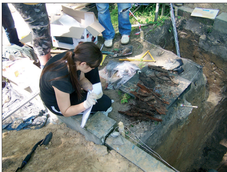
■ Obr. 13 Evidence nálezů. Foto autor.