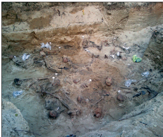
■ Obr. 19 Hrob č. 6 na střelnici Brus, léto 2010.

( obr. 16 ), pomník s dřevěným křížem a dvě haldy, možná pozůstatky zmiňované poválečné exhumace. Na tuto otázku měl pomoci odpovědět archeologický výzkum, který proběhl v létě 2011.