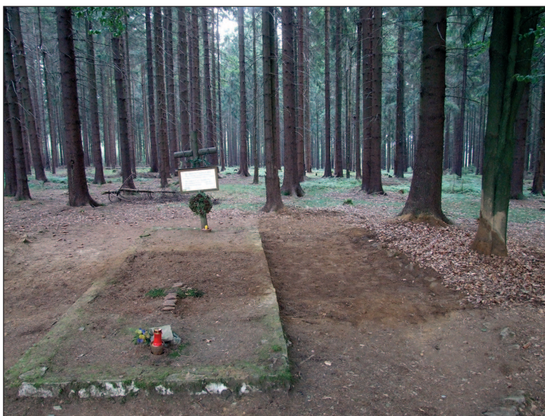
■ Obr. 1 Pomník ve Staré Knížecí Huti (okr. Tachov) po skončení výzkumu, léto 2011.

Se změnami politických režimů na konci minulého století začaly podobné výzkumy i v Evropě. Mnoho