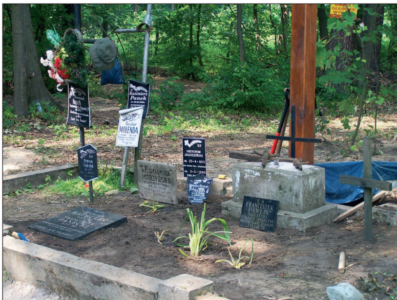
■ Obr. 15 Pomník po skončení výzkumu.