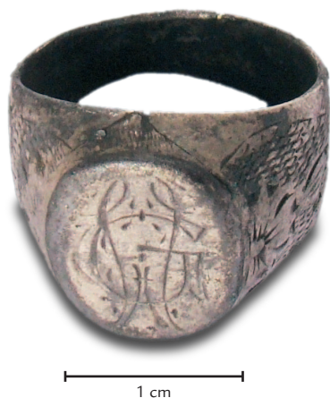
■ Obr. 10 Stříbrný prsten s iniciálou WG.

Na to měl pomoci opovédět výzkum v létě 2013, provedený u třetího ze zmiňovaných památníků (obr. 11). V jeho okolí bylo opět otevřeno několik sond, které však nic neodhalily. Bylo proto přistoupeno k výzkumu přímo v památníku. Ten má podobu betonové obruby vyplněné hlínou s květinami, uprostřed je pomník s nápisem, nad ním se tyčí velký dřevěný kříž. V mezičase se navíc objevily fotografie z poválečného pohřbu obětí z Lučiměřského lesa. Stromy na nich pak velmi připomínaly stromy v okolí pomníku. Na fotografiích jsou také zachyceny rakve s kosterními pozůstatky připravované k pohřbení. Proto byly v pomníku mezi betonovými obrubami provedeny odvrtky do hloubky 1,5 m. V prostřední části se objevily fragmenty dřeva. Možná se