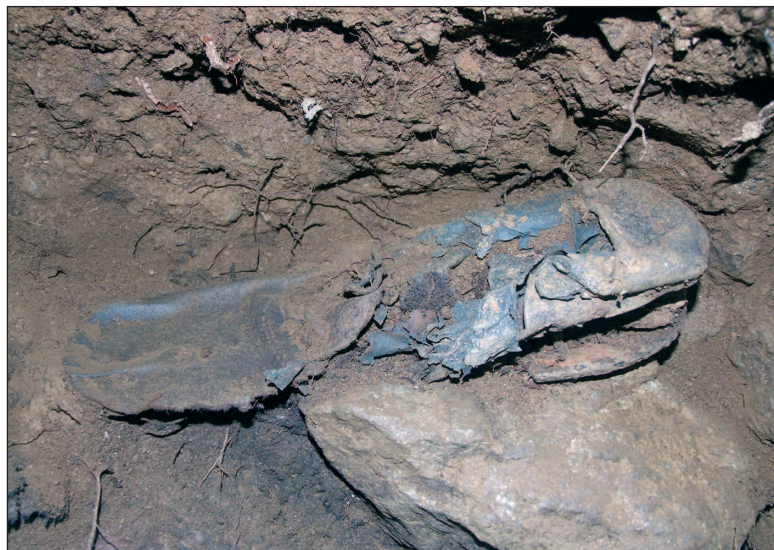
■ Obr. 2 Typický nále z hrobu ve Staré Knížecí Huti – fragment obuvi.

První projekty na tomto poli proběhly i v České republice. V létě 2010 došlo k odkrytí hromadného hrobu Němců zavražděných po skončení války v květnu 1945 u Dobronína na Jihlavsku. Tento výzkum byl vyvolán policejním vyšetřováním a jsou tak k němu k dispozici jen zprávy z tisku, protože vyšetřování je tajné. O rok později došlo k odkrytí exhumovaného hromadného hrobu z dubna 1945 u obce Stará Knížecí Huť na Tachovsku (obr. 1). V tomto hrobu se původně nacházelo 37 těl, která ale byla vyzdvížena během velké akce v září 1946 a převezena do nového