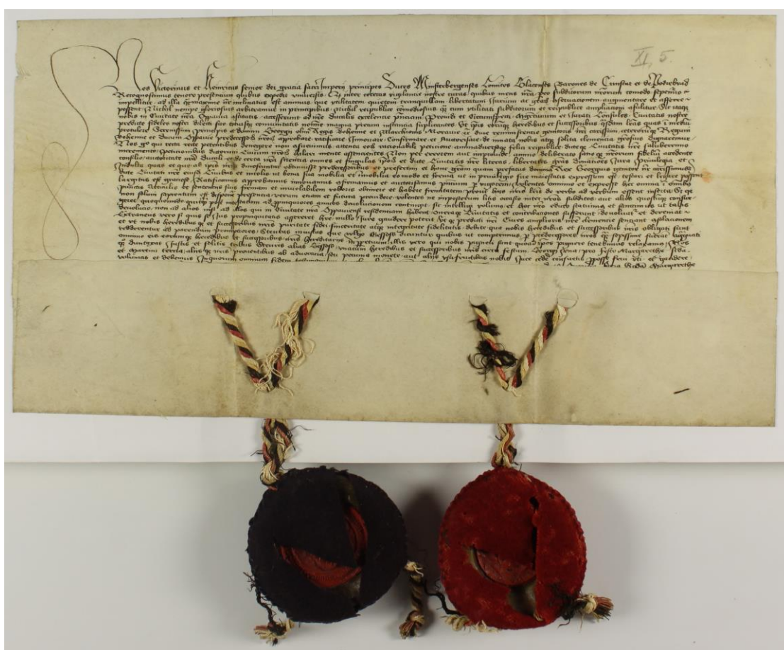
Obrázek 18: Listina vydaná 14. 7. 1472, jejímž zněním potvrdili synové krále Jiřího z Poděbrad, knížata Viktorin a Jindřich, městu Opavě práva a privilegia

Listiny jsou definovány jako písemnosti, které podávají v určitých pevných formách svědectví o právním jednání; ujednání v nich obsažená mají právní závaznost (jsou soudně vymahatelná). Hovoříme jednak o listinách vysvědčovacích (deklaratorních) , podávajících svědectví o právním pořizení, jež se konalo dříve, jednak o listinách dispozitivních (konstitutivních) , které právní pořizení teprve dovršují či zakládají. Dále lze např. rozlišovat listiny podle obsahu (privilegia, směny, smlouvy, soudní výroky...), dle autority vydavatele, tedy na veřejné (papežské, císařské, královské) nebo soukromé, a konečně podle místa jejich vzniku (kancelářské a nekancelářské).