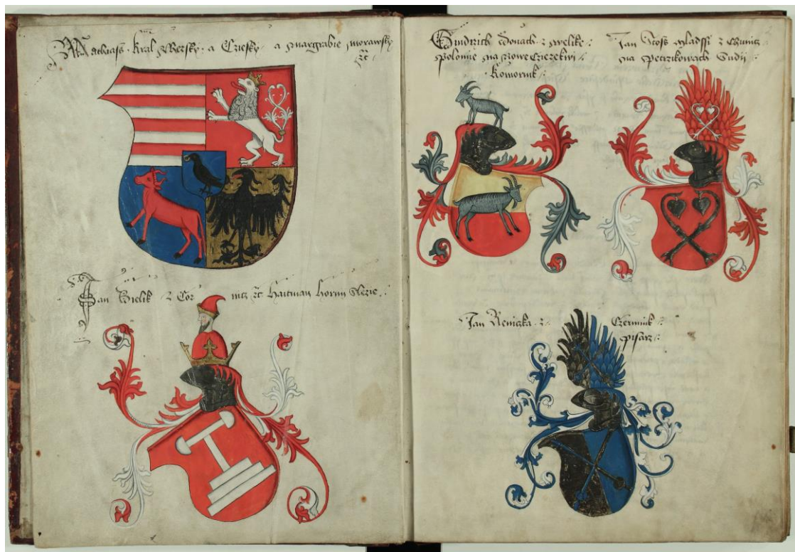
Obrázek 19: Mezi veřejné úřední knihy se počítaly tzv. zemské desky, jež sloužily k evidenci změn vlastnictví svobodného (alodního) majetku; jejich významu odpovídala honosná výzdoba a exkluzivní psací materiál – pergamen (zde svazek zemských desk opavského knížectví z let 1486-1522)

zápisy, které měly obecnou právní závaznost, zajišťovaly právní pořízení. Často proto nahrazovaly listiny. Patří sem zemské a dvorské desky, městské a vrchnostenské pozemkové knihy, urbáře, matriky, knihy veřejných notářů apod.). Knihy určené pro vnitřní potřebu úřadů reprezentují nejčastěji nejrůznější kancelářské pomůcky sloužící k evidenci úřední agendy a k snadnější orientaci v ní (typicky různé kopiáře, registra, podací protokoly, indexy, elenchy atd.).