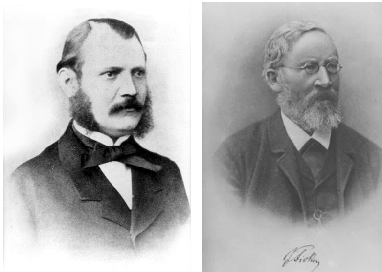
Obrázek 26: Theodor von Sickel (1826-1908) a Julius von Ficker (1885-1902), vynikající odborníci na poli ediční práce a diplomatiky, vychovali řadu významných následovníků (v tom i z českých zemí)

Vedle MGH představují co do významu druhý nejdůležitější ediční podnik (přinejmenším v kontextu střední Evropy) Regesta Imperii (ve zkratce RI). Projekt, u jeho zrodu stál roku 1830 Johann Friedrich Böhrer († 1863) je dodnes neustále zdokonalován, jednotlivé svazky jsou přepracovávány a doplňovány. Jednou z nejvýznamnějších osobností byl současník Theodora von Sickel, Julius von Ficker (†1902). Zatímco MGH slouží k publikování historických pramenů k dějinám středověké Svaté říše římské (a jejich přímých předchůdců) in extenso, jsou RI (jak název napovídá) registářem. Obě ediční řady patří k významným zdrojům pramenů k českým dějinám.