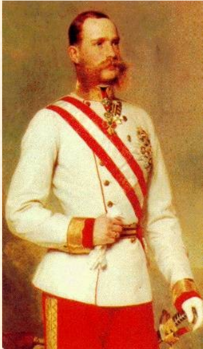
Císař František Josef I., který stál v čele Rakouska-Uherska