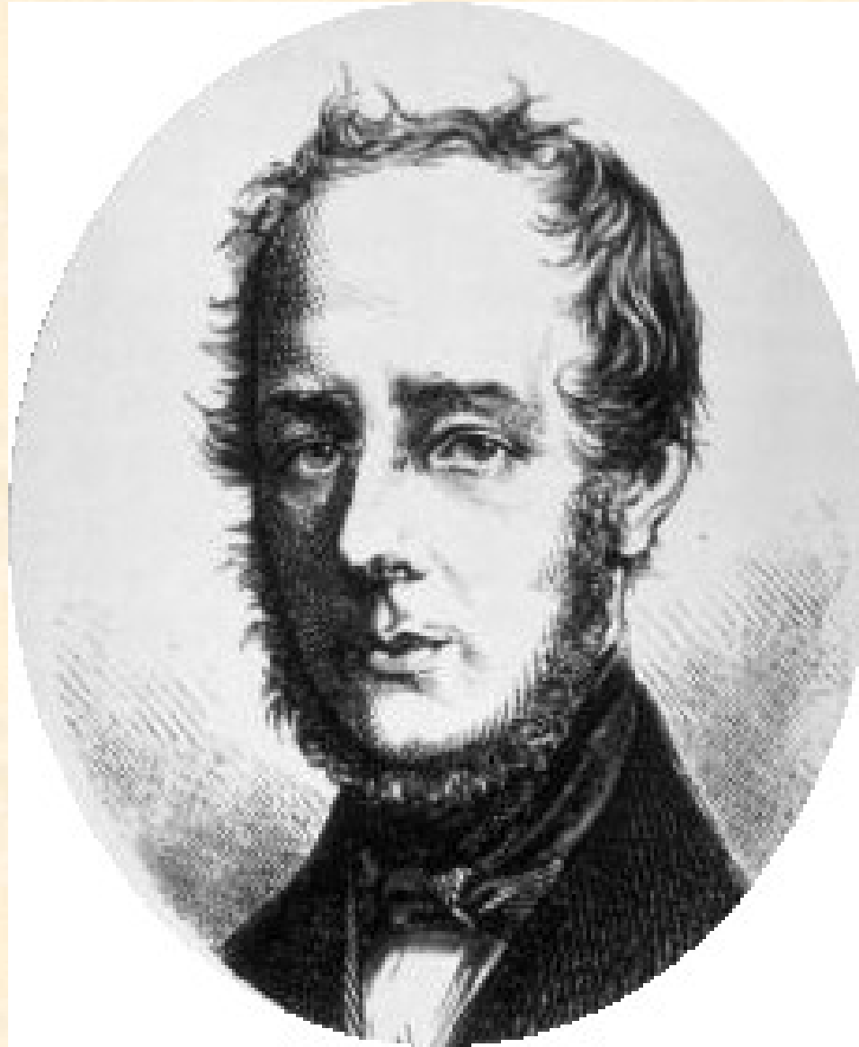
Franz Seraph von Stadion, jeden z tvůrců státní správy po r. 1848