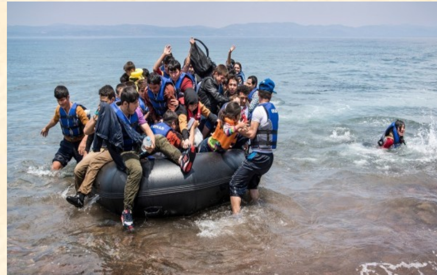
Migrační krize oživila debatu o obnovení vlivu národního státu v 21. století