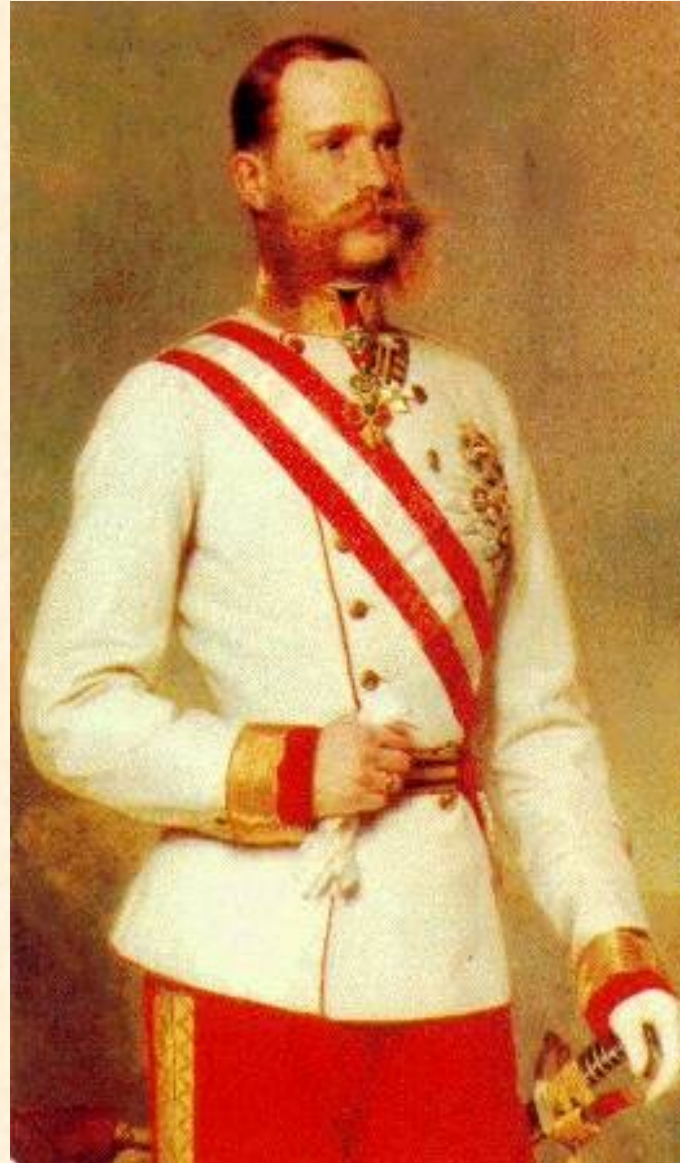
Císař František Josef I., který stál v čele Rakouska-Uherska