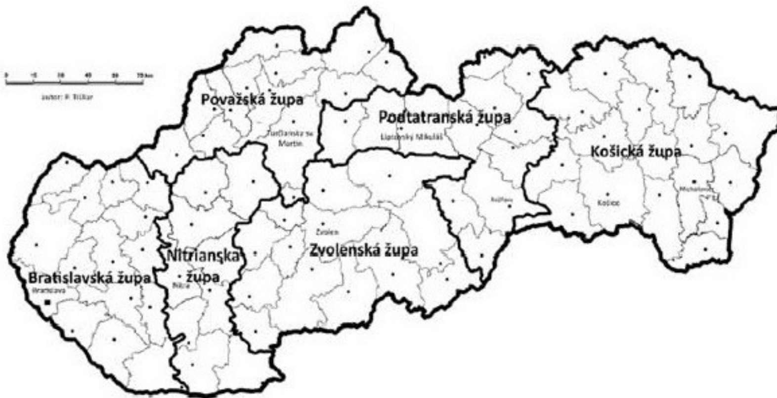
Obrázok č. 2 : Mapka prvého župného zriadenia na Slovensku v rokoch 1923 – 1928