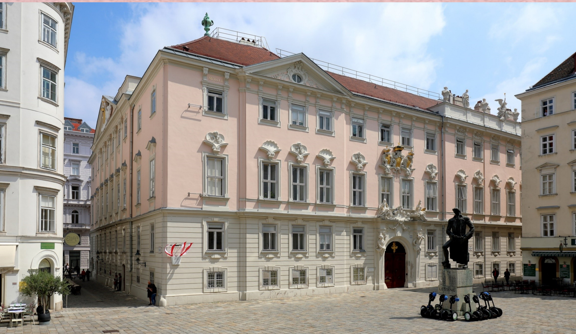
Sídlo České dvorské kanceláře ve Vídni