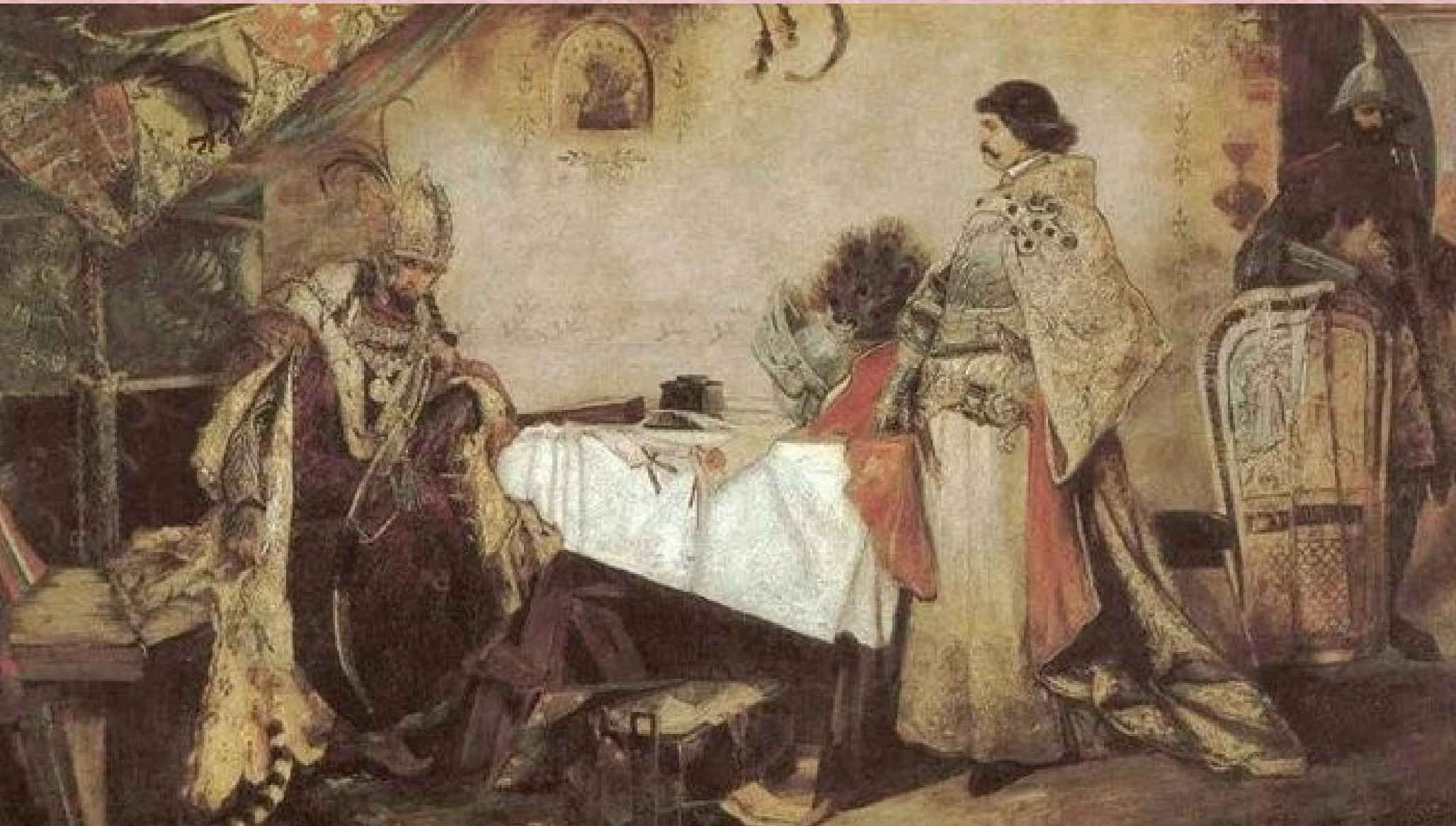
Česká král Jiří z Poděbrad a uherský král Matyáš Korvín