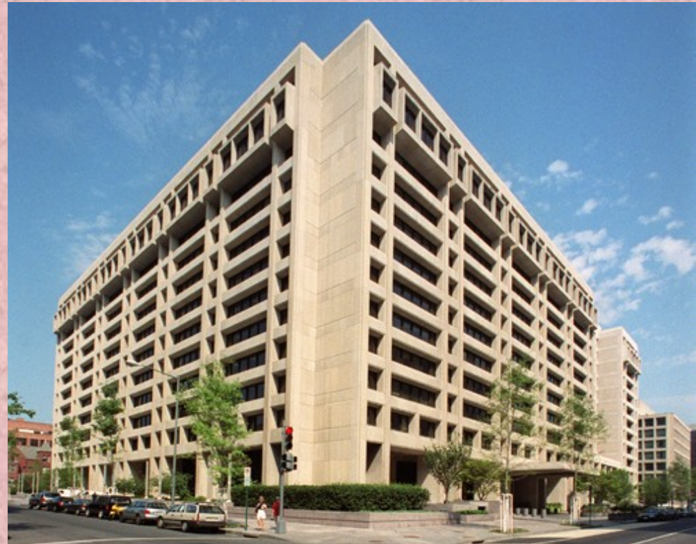
Budova ústředí IMF ve Washingtonu