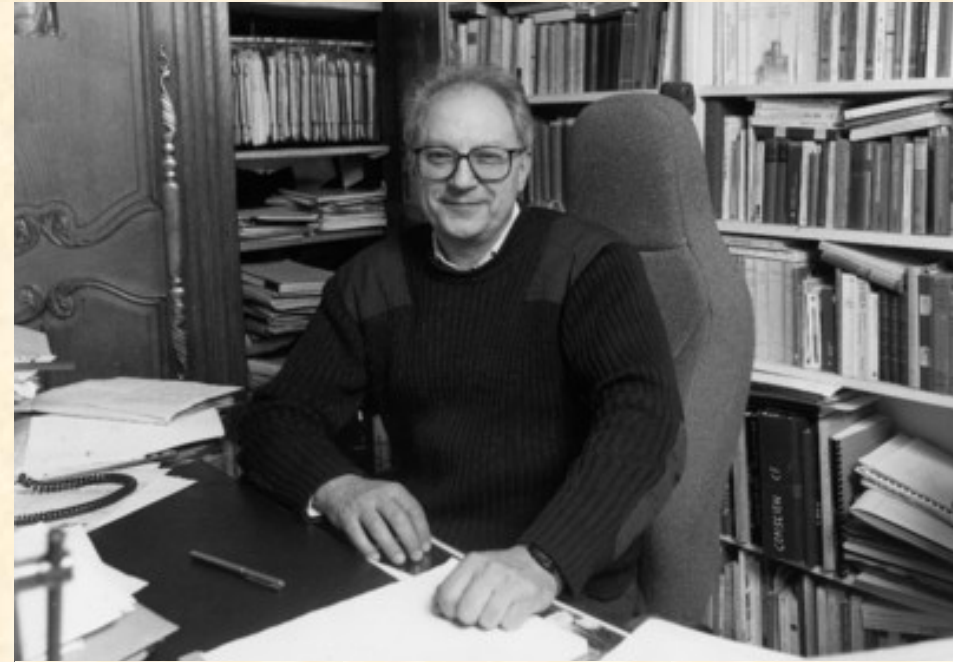
Francouzský filosof Etienne Balibar