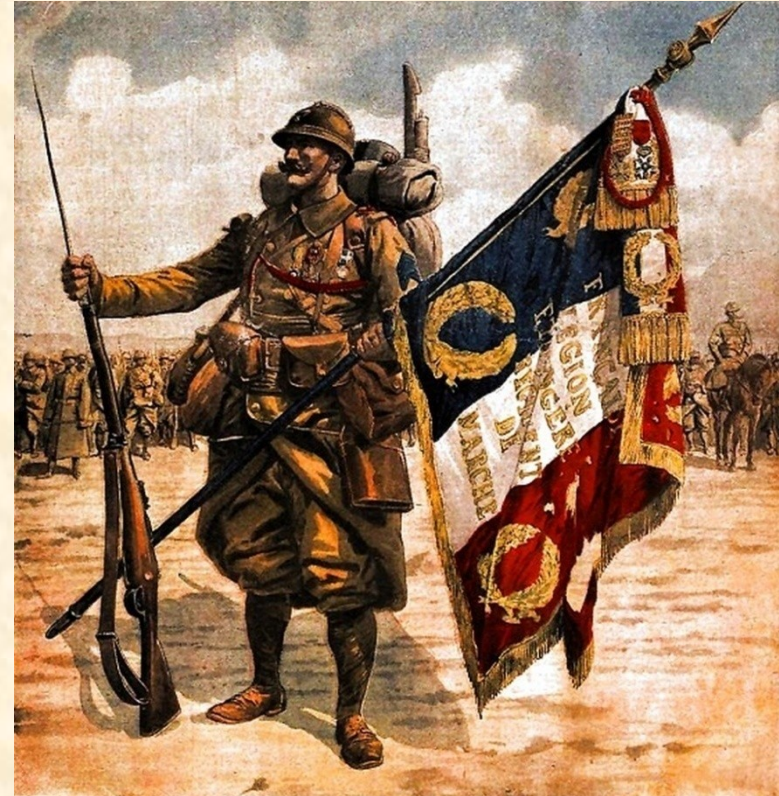
Francouzská třetí republika vytvořila hluboké republikánské tradice