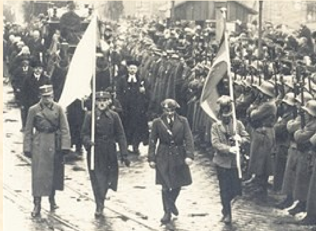
Mezi tradiční menšiny v českých zemích patří Poláci