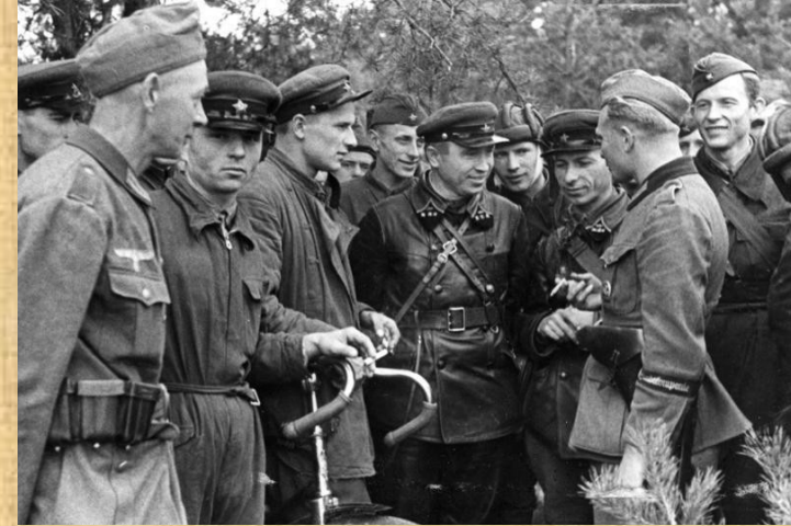
Němečtí a sovětsí vojáci na území Polska