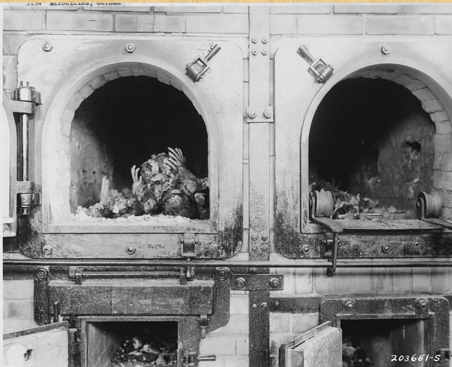
Pec na spalování těl v koncentračním táboře Buchenwald