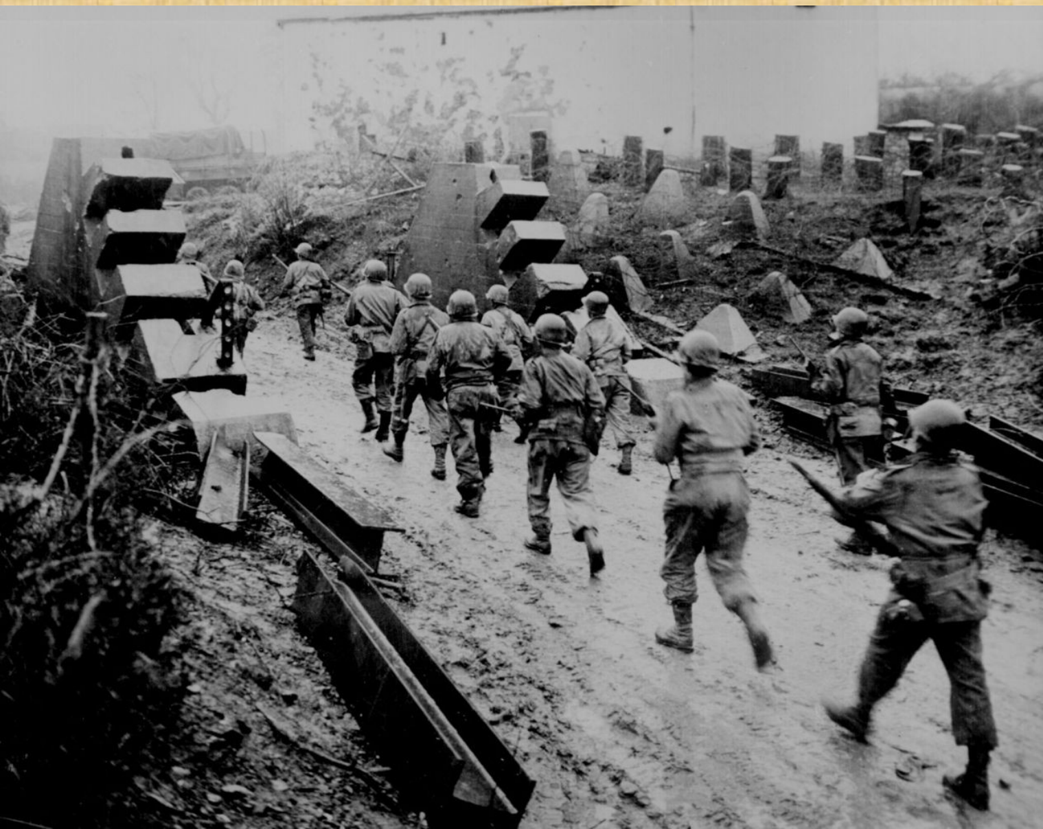
Američané vstupují do Německa