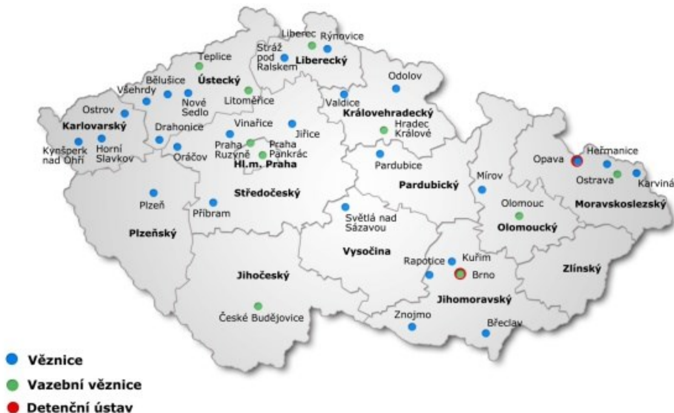
Obr. Mapa českých věznic a vazebních věznic. ( www.vscr.cz )