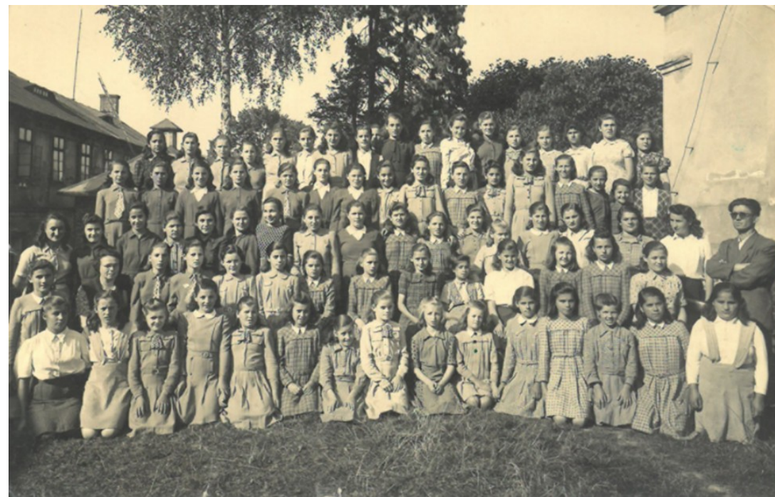
Řecké dívky v domově v Krásném Poli u Varnsdorfu 1949