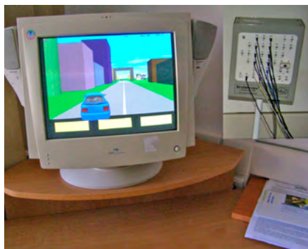
Obrázek 3: EEG biofeedback

( Tangramy, Loplíner ), propriocepci a rovnováhu s pomocí balančních pomůcek (např. pedoball, šlapadlo, nestabilní plocha, točna, lavor ), popř. knoflíku na niti, joja .