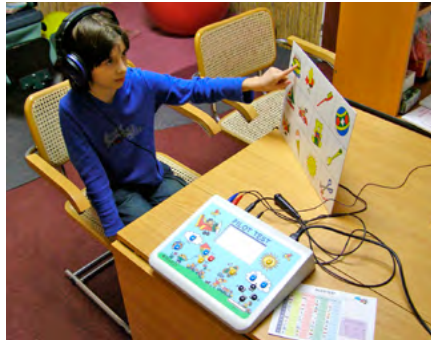
Obrázek 1: Pilot Hearing Test – screening sluchu

Od zřejmě primárně fyziologického (?) stavu docházelo postupně ke ztrátám v oblasti vysokých tónů. Po orientačním vyšetření specialistou 9 byl zjištěn pokles ve frekvenční oblasti nad 4 000 Hz (ve 3,5 letech).