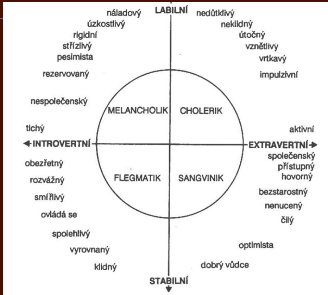
Schéma vlastností a typů temperamentu dle Eysencka