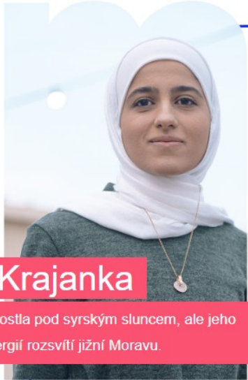
IIKrajanka Vyrostla pod syrským sluncem, ale jeho energií rozsvítí jižní Moravu.