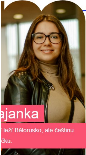
Krajanka ...leží Bělorusko, ale češtinu ...čku.