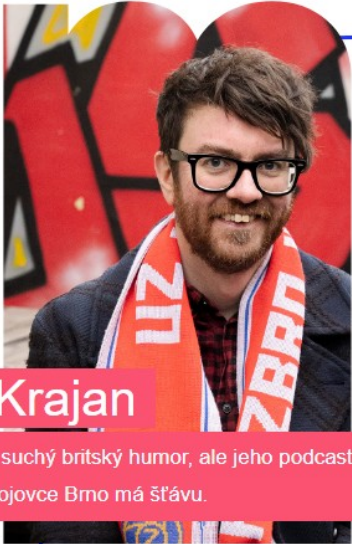
IIKrajan Má suchý britský humor, ale jeho podcast o Zbrojovce Brno má šňávu.