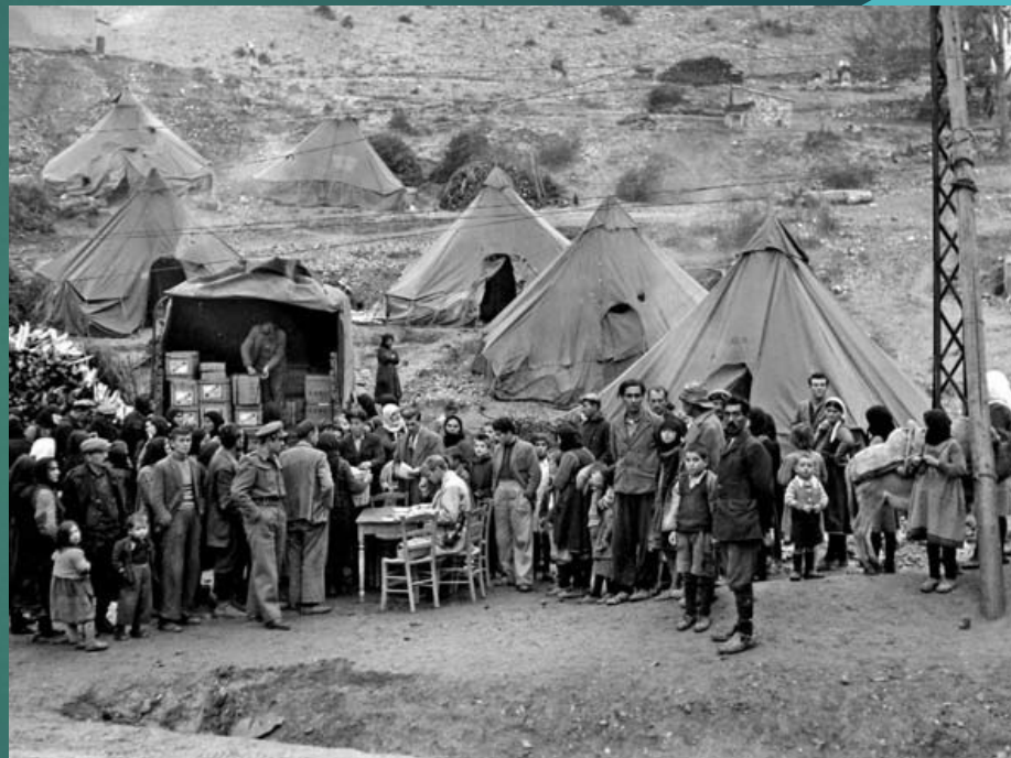
Mezinárodní pomoc obětem občanské války (Kastoria, 1948).