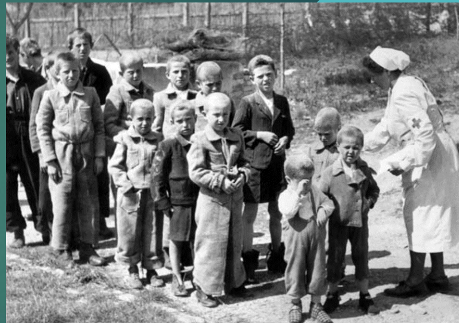
Řecké děti v přijímacím středisku (Mikulov, 1. května 1948).

„Přerušili nám kořeny. To je velmi bolestivé, protože děšť, který na vás padá, není deštěm vaší vlasti. “