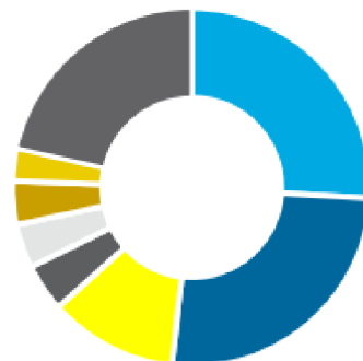
Podíl zemí EU na počtu aktivních držitelů dočasné ochrany