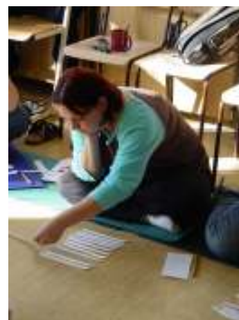
práce s motivy