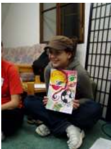
můj „ideální“ klient