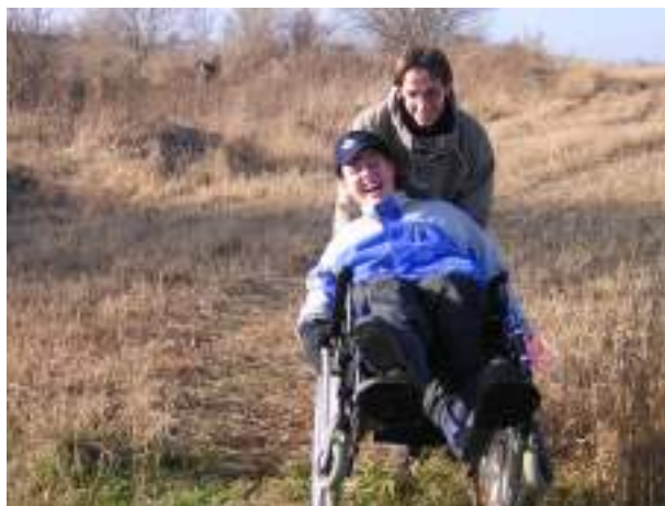
dobrovolník se svým klientem

Sportovní a vzdělávací činnost – na rozdíl od zemí EU a USA, kde se dobrovolníci výrazně podílejí na vzdělávacím procesu, především u dětí základních škol a dětí se vzdělávacími a výchovnými problémy, se v ČR dobrovolnictví v těchto oblastech omezuje převážně na mimoškolní volnočasové aktivity. Zejména jde o tradici mimoškolních zájmových kroužků, tělovýchovných a turistických oddílů, které po změně režimu v roce 1989 si jen svobodně vydechli a nadále vyvíjejí a rozšiřují svoji činnost. Na činnosti v těchto oblastech se podílejí významnou měrou i výše zmíněné dětské a mládežnické organizace.