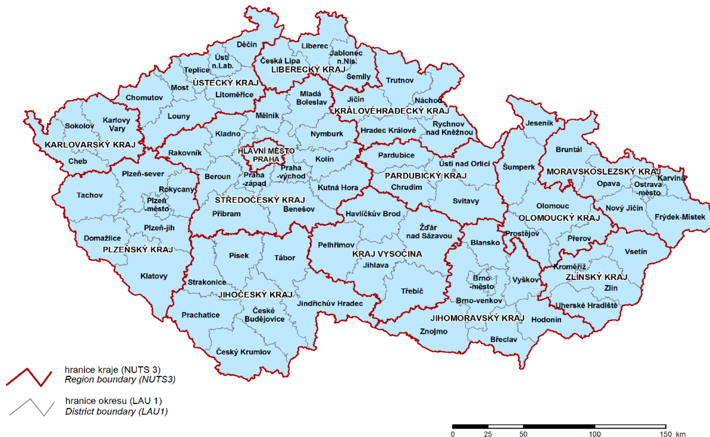
Kraje (NUTS 3) a okresy (LAU 1) České republiky Regions (NUTS 3) and Districts (LAU 1) in the Czech Republic