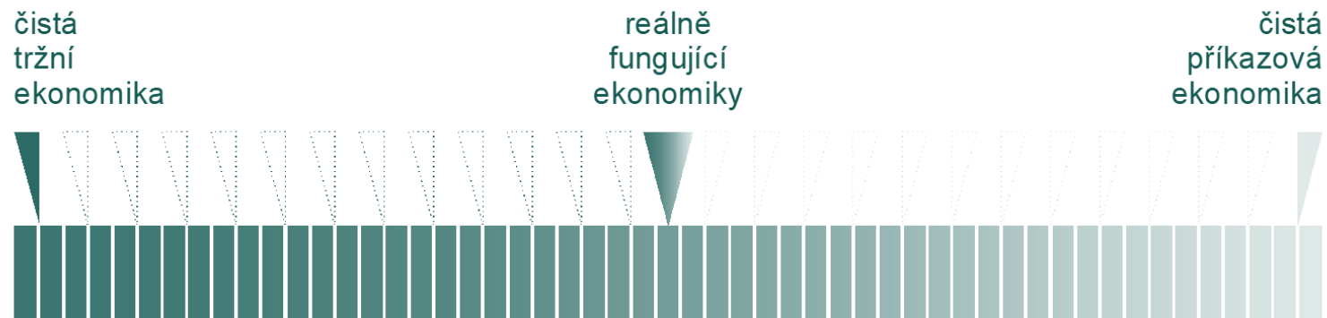
Obrázek 1 – Spektrum ekonomických systémů

Pramen: Odvozeno dle Lašek (1993, s. 10).