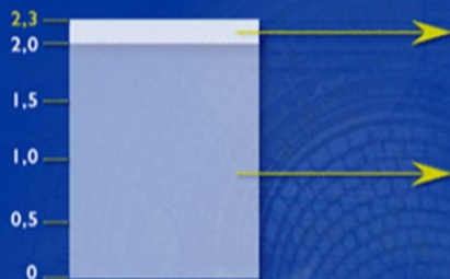
Celková míra inflace v roce 2002

Inflace přímo související se zavedením eurobankovek a mincí