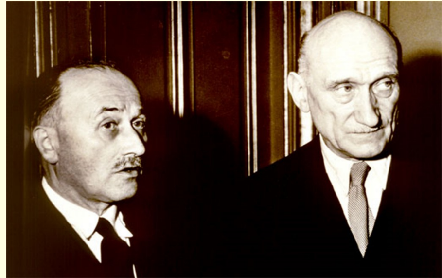
Jean Monnet a Robert Schuman