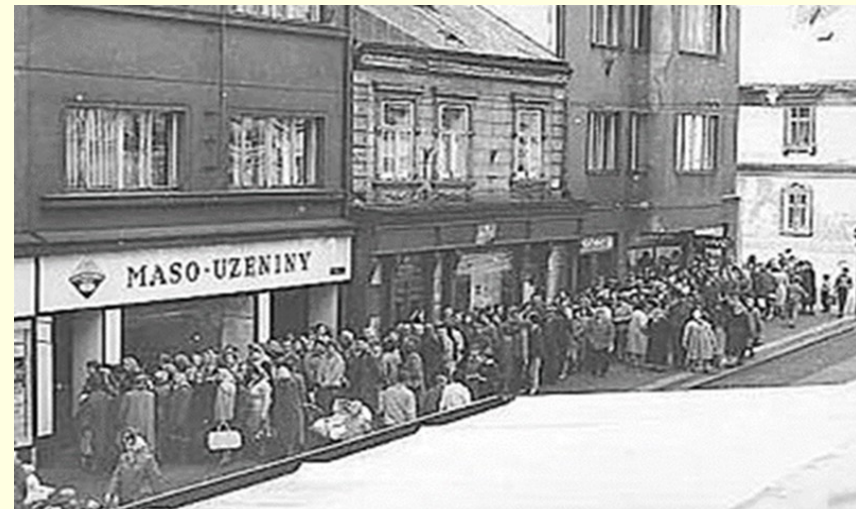
Masna s frontou