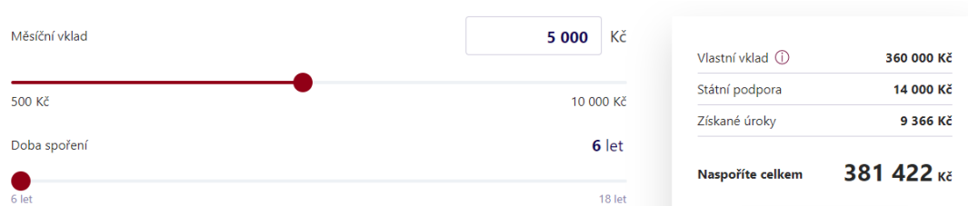
Obrázek č. 2: Zhodnocení stavebního spoření