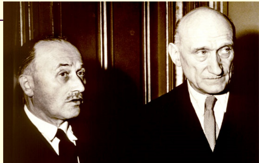
Jean Monnet a Robert Schuman