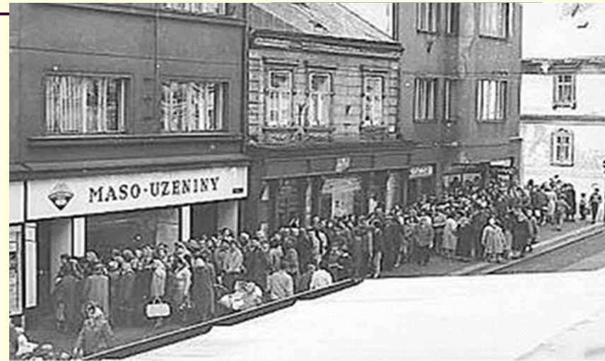
Masna s frontou