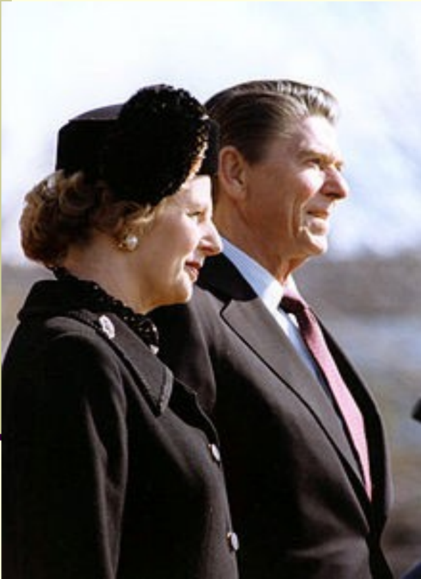
Margaret Thatcherová a Ronald Reagan, prezident USA