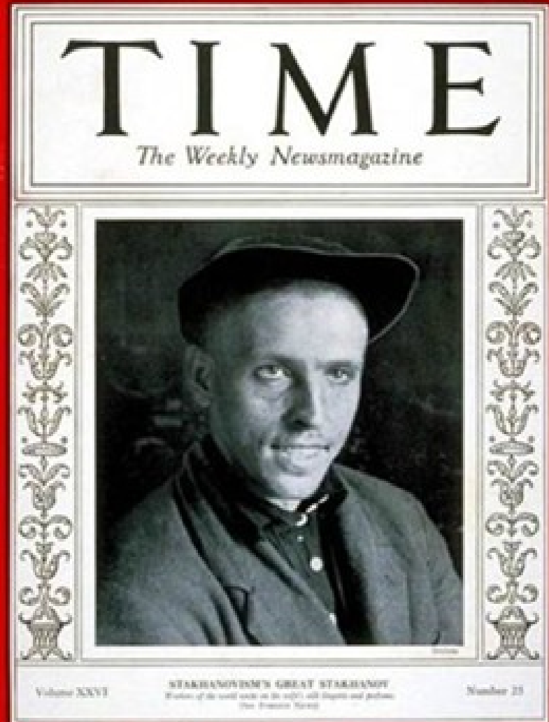
Illustration: This issue covers the USSR