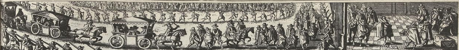
Gefangene werden ins Schloß gefuhrt, mit ein Starcke Guardi. Convorirt dem die Kayserliche Commissarien einem ieden absonderlich das Urtheil öffentlich vorlesen lassen