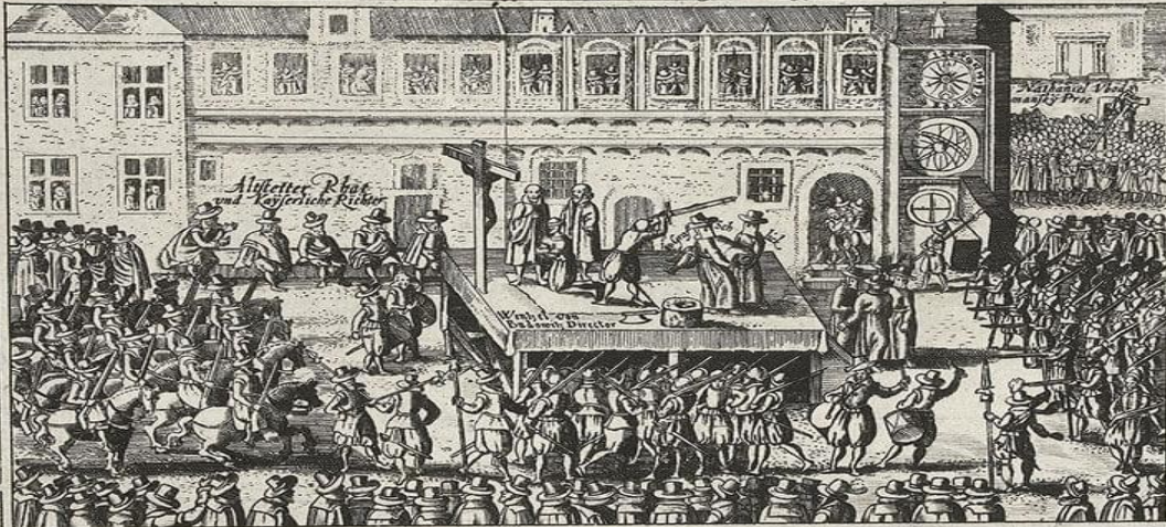
Verzeichnis was gestalt der Graff von Schlick vnd andre hohe vnd Niderstands Personen hingericht vnd vollzogen worden.