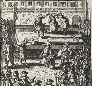
Execution über Doctor Medic: Iessenium.