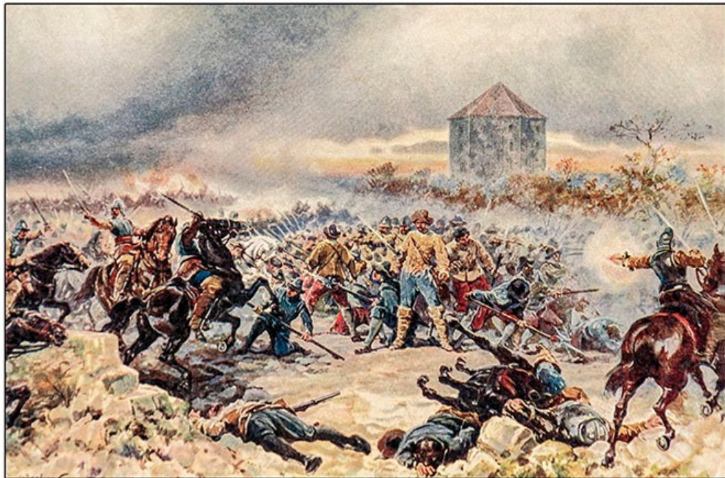
Poslední odpor Moravanů na Bílé Hoře