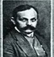
Machar J. J.